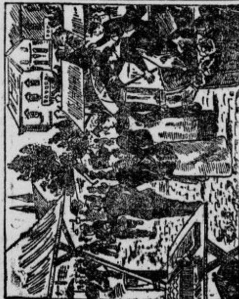
Kje je tatič?

2 učenca išče mizar, Slovenec v Zagrebu, Prednost imajo oni, ki so se že učili. Stanovanje in oskrbo dobe, ostalo po dogovoru. — RABIČ, Trnjavska 57 — Zagreb. 1363