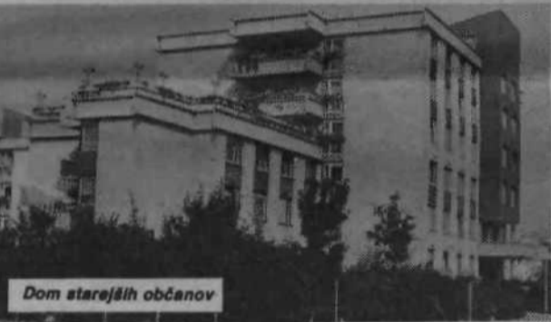
Dom starejših občanov