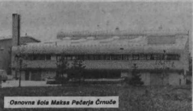
Osnovna šola Maksa Pečarja Črnuče