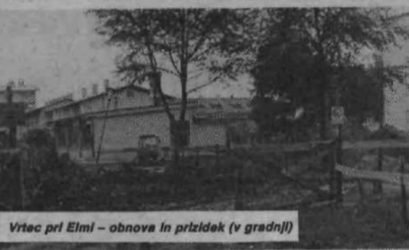
Vrtec pri Elmi - obnova in prizidek (v gradnji)