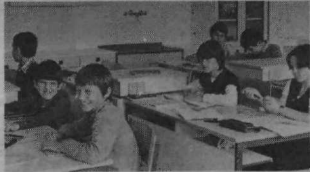
V prizidku so tudi štiri nove učilnice, namenjene za kabinetski pouk. Njihova skupna značilnost: izredno lepe in svetle so, znanje gre v njih skorajda samo v glavo, bi lahko zapisali.