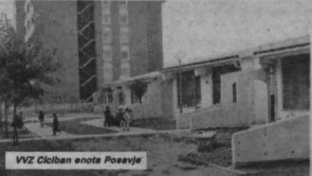
VVZ Ciciban enota Posavje