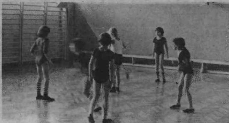
Dobili pa so tudi malo telovadnico in razširjeno zaklonišče. Uradna otvoritev omenjenih prostorov bo sicer šele prihodnji mesec, vse prostore pa že zdaj s pridom uporabljajo.