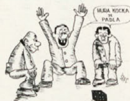
O delu komisije za organiziranje in vrednotenje