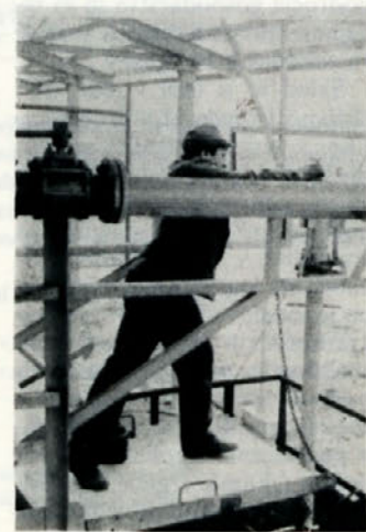
Natakanje žveplove kisline v vagozno cisterno

Pri predvideni intenzifikaciji titanovega dioksida na 26.000 t letno in pri uporabi titanove žilndre (do 30 %) se poveča količina kislinskih odplak za več kot polovico, kar je v projektni dokumentaciji predvideno. Sama uvedba apnenčeve moke predstavlja praktično povečanje zmogljivosti nevtralizacije. Ob predvidenem izpadu ali zaustavitvi, dosedanje postrojenje prevzame kompletno nevtralizacijo brez spremembe kot do sedaj.