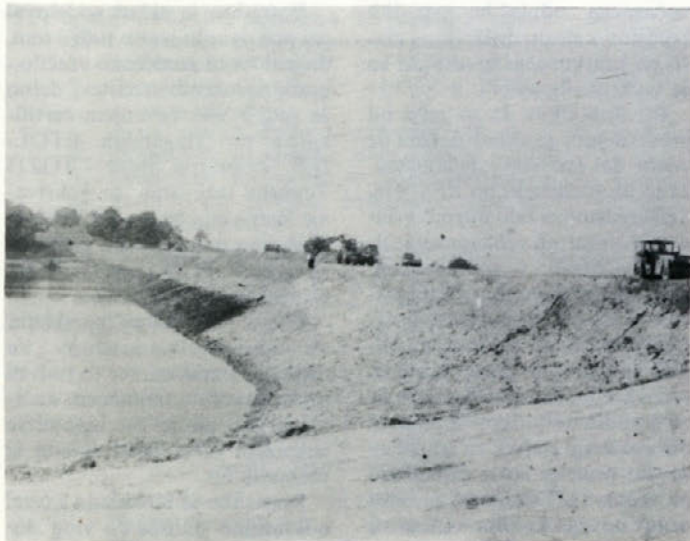
Odlagališče nevtralizacijskega blata-sadre v Bukovžlaku

no za krajane obeh občin. Sedaj potekajo razgovori med komunalnima podjetjema obeh občin za kompletno ureditev vodovodnega omrežja na mejnem področju, da ne bo prav občinska meja tam, do koder bo uren vodovod.