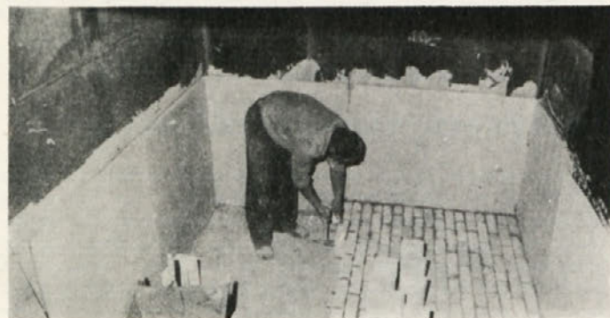
Obzidava retielted peči za taljenje surovega cinka s šamotno opeko - Metalurgija