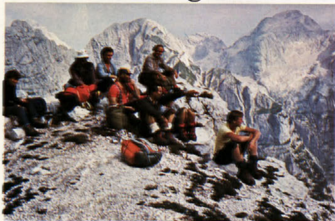
Počitek na poti preko Plamenic na Triglav

Poletni dan je lahko sončen ali meglen, topel ali hladen. To dokazujeta dva dneva, ki sem jih prebila v planinah.