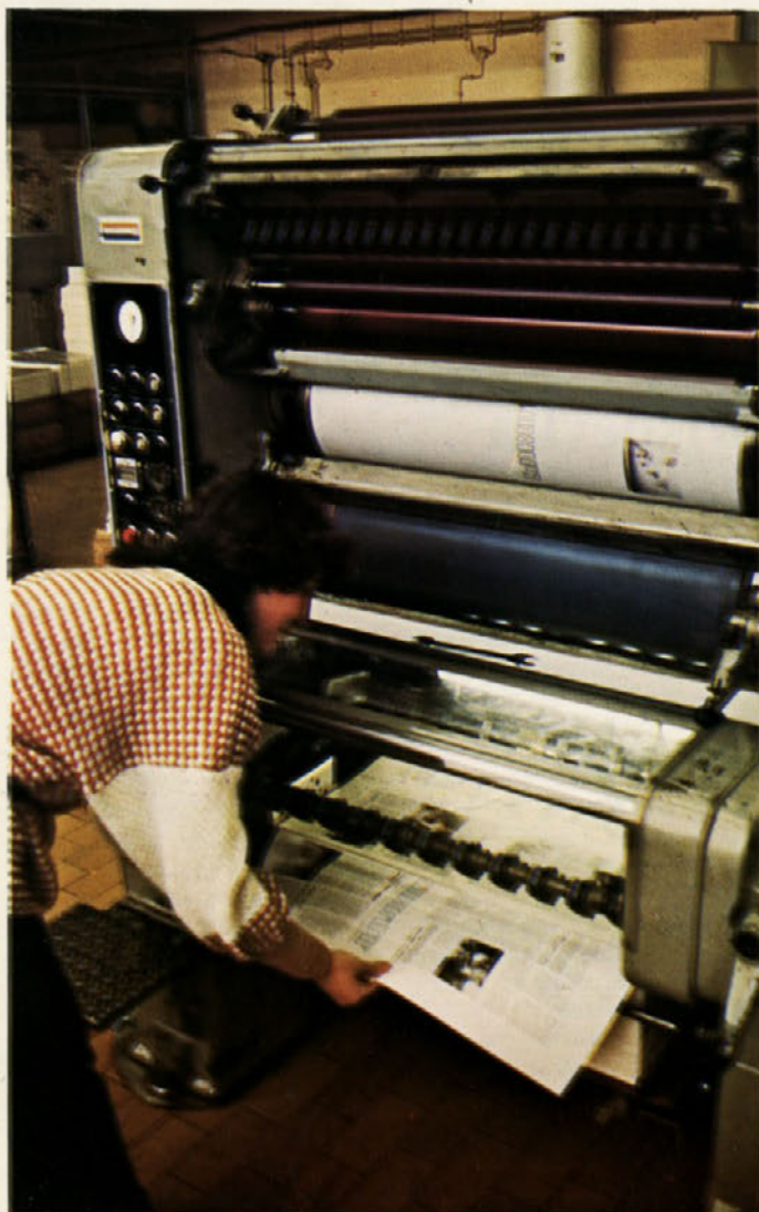
1. marca 1954 je izšla prva številka glasila Cinkarnar, sedaj pa je od tega že 30 let!

Skupno znaša planirani dohodek 2.916.093.213 dinarjev, medtem ko je bil dosežen v letu 1983 v višini 2.382.150.392 din.