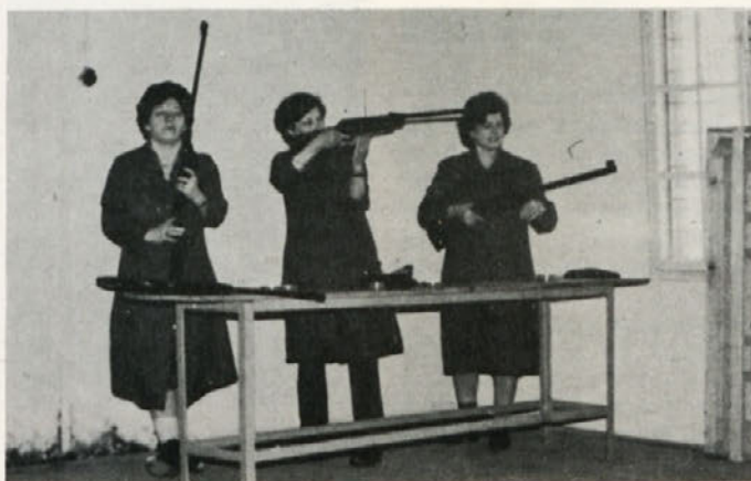
Strelke iz Grafike med tekmovanjem

Vsako leto ob dnevu žena strelska sekcija organizira tekmovanje v streljanju z zračno