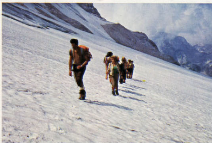
Ledenik pod Triglavom

S Skute smo krenili žez Turško goro do Kamniškega sedla