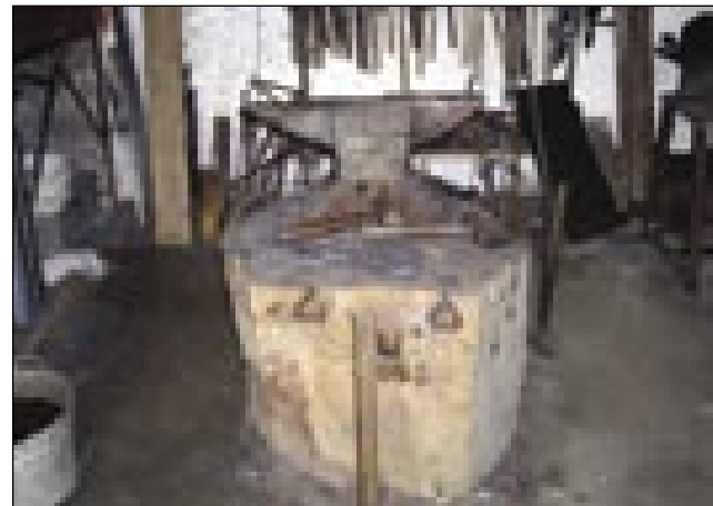
Nakovalo iz leta 1912 v Puconcaj

njem kcoj včiu, te pa eške dve leti pri kovači Cigüt Franci v Martjancaj. Pomočniški izpit ( segédvizsga ) je napravo v Maribori, šou k sodakom, kak tistoga časa vsi mladi podje, te pa delo na Bliski v Soboti. Leta 1969 je doma odpro obrt (kovačnico), poleg toga pa je biu med leti 1984 in 2000 eške