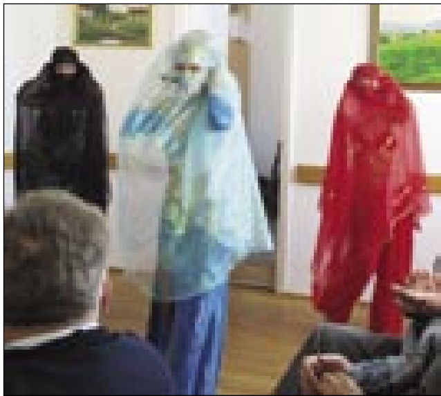
Muslimanke si morejo dostakrat skriti obraz

Sombotelško društvo trn' dosta programov má v ednom leti. Eške dobro, ka na tēj srečanjaj flajsne rokē vse s fotoa-