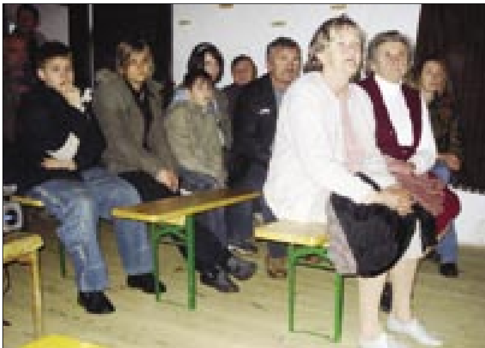
Andovčani med gledanjem filma

Režiser pa scenarist oddaj Milivoj Miki Roš je pa tapravo, kak se je rodila ideja o Podplatopisi, pa tau to, ka paut pod podplate vzeme pisatelj Zlatko Zajc , steroga po tistom, ka najde pa prešte ništerne knjige o Porabji, začnejo srbeti podplati pa mujs mora na paut.