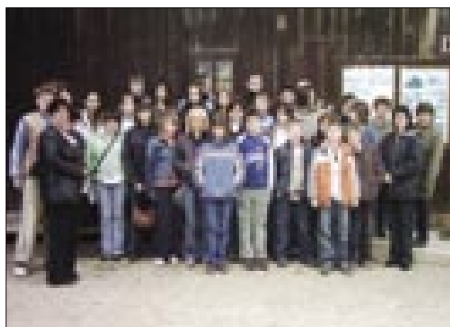
Skupinska slika pri Babičevem mlinu

4. aprila 2008 smo učenci in učitelji, ki smo 28. novembra 2007 sodelovali na tekmovanju iz porabske literature, šli na izlet v Prekmurje. Ta izlet nam je organiziral Zavod za šolstvo Republike Slovenije preko turistične agencije „Pütra“ v Murski Soboti. Na