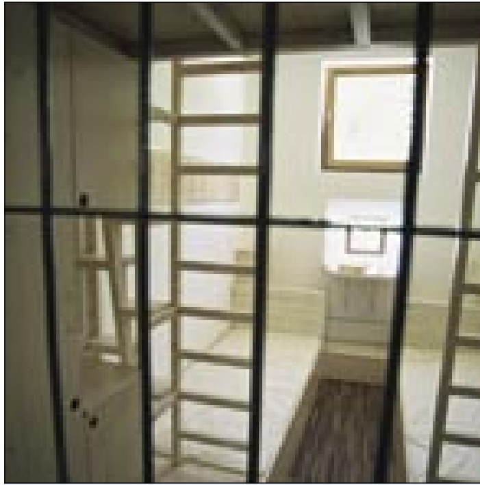
Preprosta, a draga celica

Najin prvi cilj je bil Mestni muzej Ljubljane, kjer sva si ogledali novo stalno razstavo z naslovom Obrazi Ljubljane, ki predstavlja razvoj Ljubljane od prastarih časov do danes. Predstavljene so preobrazbe Ljubljane med zgodovino, zakladi, razmerje med naravo in mestom, kako se je spreminjal položaj moških in žensk, otrok in mladostnikov skozi čas. Dobimo lahko vpogled