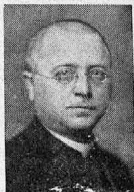
Dr. Jan Šramek preds. čl. Orla