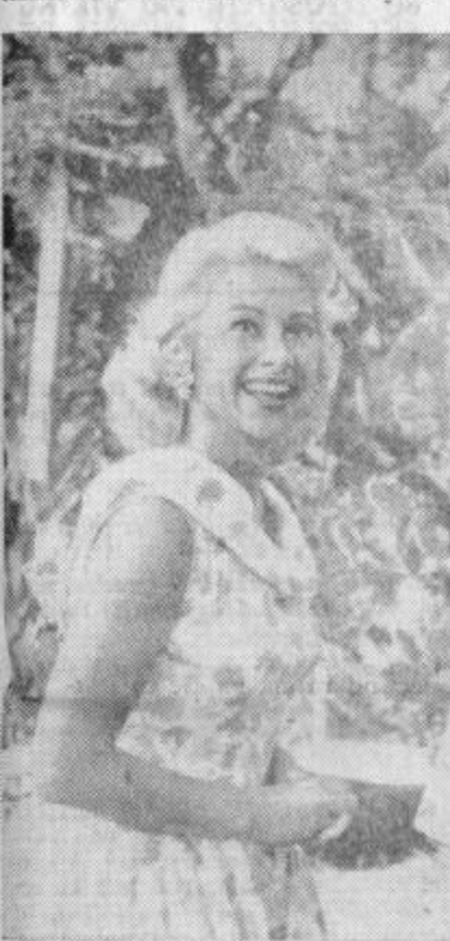
Martine Carol, francoska seks-bomba iz časov pred BB, je bila za Hemingwaya vedno ena izmed največjih znamenitosti Pariza