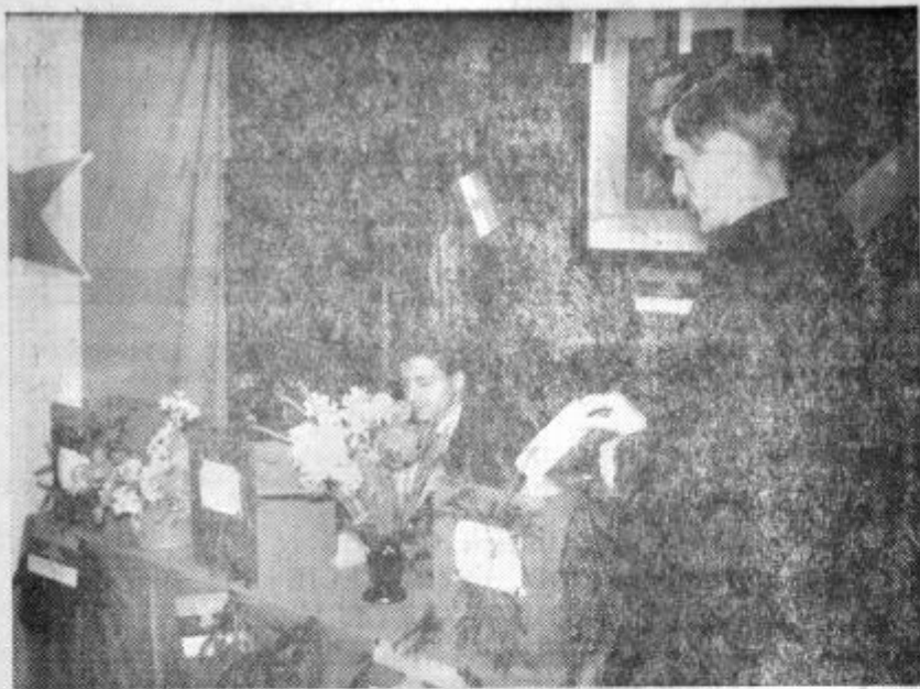
MINULI DNEVI SO V DELOVNE ORGANIZACIJE VNESLI VELIKO SLOVESNEGA VZDUŠJA. K TEMU SO PRISPEVALI NE SAMO BLIZNI PRAZNIK DELA IN OBLETNICA USTANOVITVE OSVOBODILNE FRONTE, TEMVEČ PRAV TAKO VOLITVE V SAMOUPRAVNE ORGANE, S KATERIMI SO PROIZVAJALCI IZBRALI TOVARISE, ZA KATERE MENIJO, DA BODO NAJBOLJE ZASTOPALI NJIHOVA MNENJA IN STALIŠČA. MNOGI SO POHITELI NA VOLIŠČA ZE V ZGODNIH JUTRANJIH URAH. VSEM NOVOIZVOLJENIM ČLANOM DELAVSKIH SVETOV ISKRENO CESTITAMO IN JIM ŽELIMO SE VELIKO DELOVNIH USPEHOV! POSNETEK PRIKAŽUJE VOLITVE V TOVARNI »EMO« V CELJU.