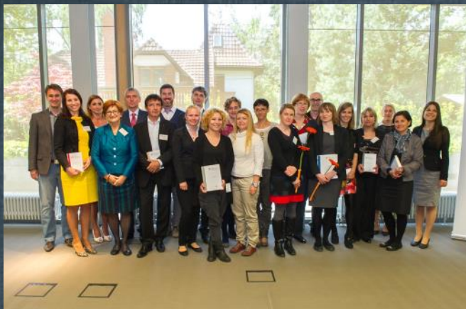
Prejemniki nagrade družbeno odgovornih podjetniških praks