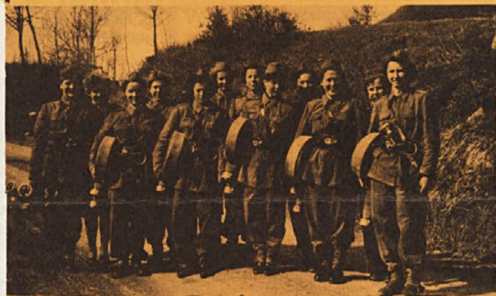
Ženska desetina pred leti . . .

Na sliki so naše poklicne gasilke, ki so se v letu 1973 pomerile z drugimi gasilkami na medobčinskem tekmovanju v Novem mestu in na republiškem lesno-industrijskem tekmovanju v Logatcu ter dosegle zaslužno 2. mesto v republiki.