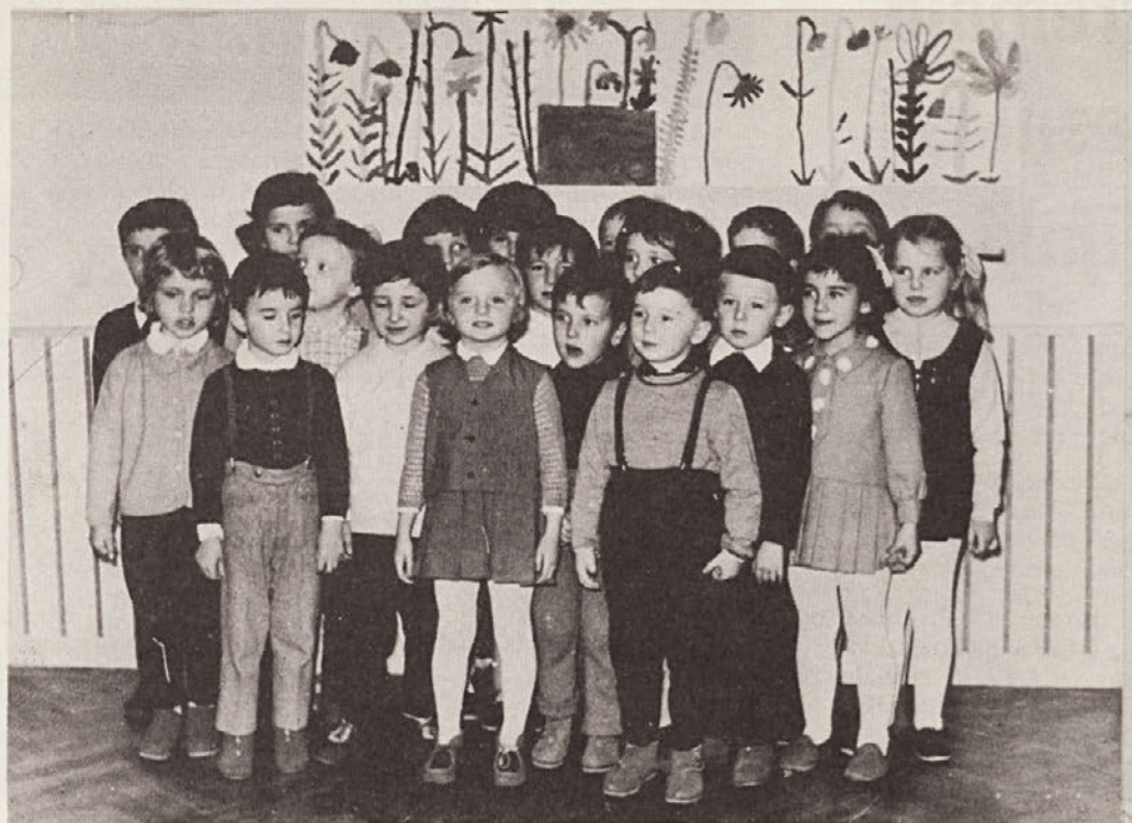
Vesetje za najmlajše — v prenovljenem vrtecu.