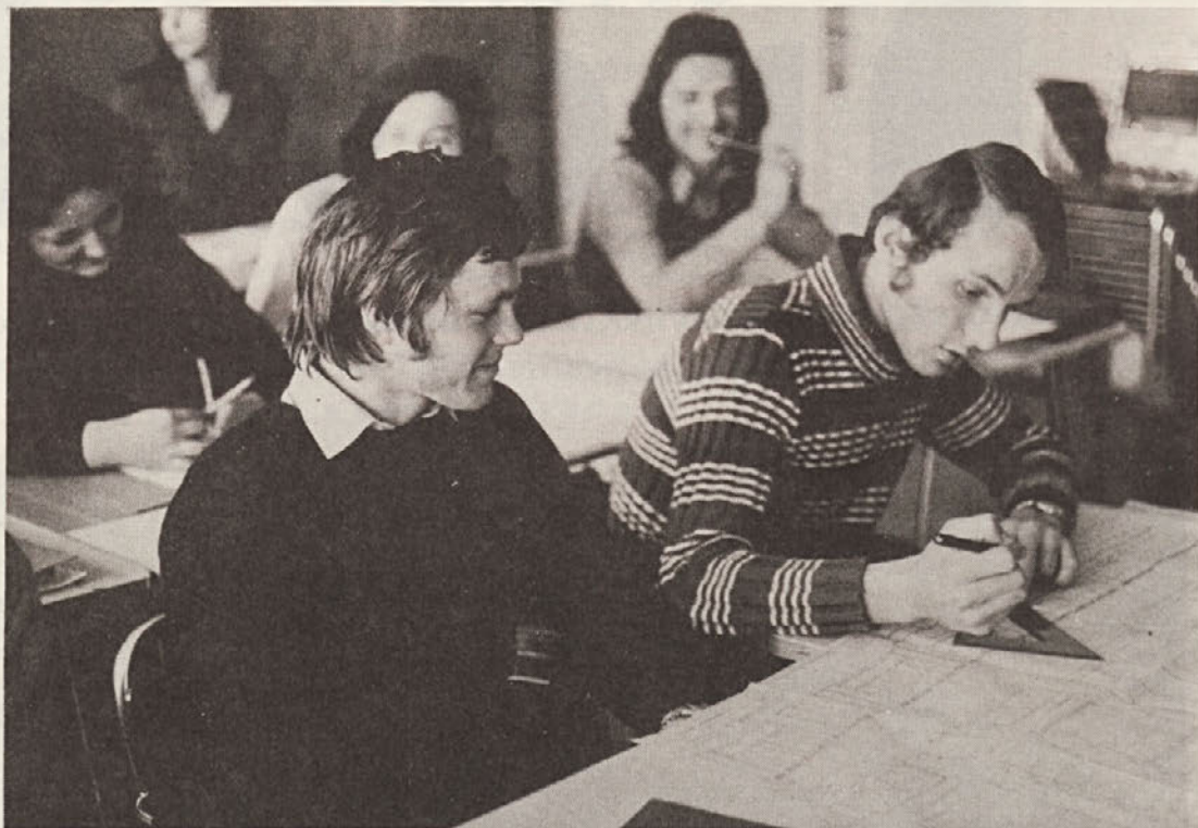
Kar se naučimo v šoli, moramo znati uporabljati na delovnem mestu.

Ob tem se je treba zamisliti: človek toliko velja, kolikor zna. In tudi ob tem: kar se Janezek nauči, to Janez zna. Zna – in to se mu tudi pozna. Recimo ob koncu meseca ali okrog petnajstega, ko zažvenkečejo na plačilni dan beliči. Kdor malo zna, manj zmore, njegov zaslužek gotovo ne more biti tolikšen kot tistega, ki ima „glavo na pravem koncu“. Znati, izobraževati se – za življenje, kot so učili v šoli – to je poziv časa.