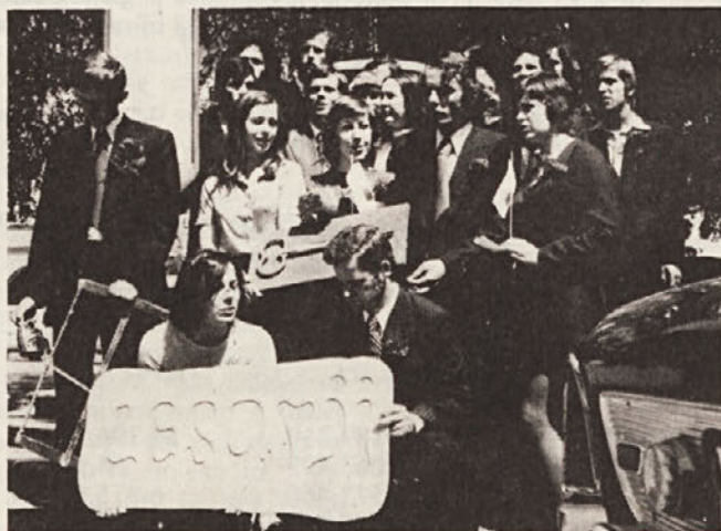
Še spomin na prvi „gaudeamus igitur“ prvih lesnih tehnikov.

Če se bomo držali pravila „Pravega človeka na pravo delovno mesto“ in jih bomo v delo pravilno uvedli, jim nudili vsestransko pomoč, bomo lahko opravičili stroške in trud, ki smo ga vložili. Upamo, da bomo z njimi dobili prave, vsestransko usposobljene strokovnjake, ki bodo prispevali svoj delež k razvoju in napredku Novolesa.