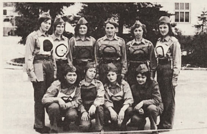
. . . in danes, vendar pri tem številu ne sme ostati

Ta desetina se pripravlja na ponovno tekmovanje, ki bo v Novem mestu in na tekmovanje v Meblu (Nova Gorica). Mislim, da bo desetina zopet dosegla dobre rezultate na obeh tekmovanjih.