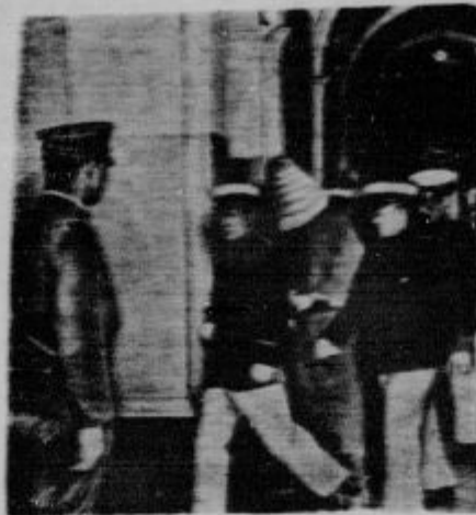
Mikadov atentator. Mladí Korejec Li Hosio, ki je v januarju izvršil atentat na japonskega cesarja Hirohita, je bil te dni obsojen na smrt. Na sliki vidimo morilca, ko ga vedejo na morišče. Glavo ima pokrito s pokrivalom, podobnim kosari.