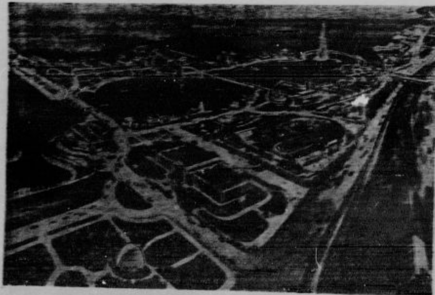
Obnove napredka. Pod tem naslovom bo, kakor morda, v bližnji prihodnje leto svetovna razstava, za katere se že sedaj za velika pripravljajo. Na sliki vidimo severno polovico razstavne pokrajine, ki obsega več kot 300 akrov zemlje. Z razstavo misli Chicago predstaviti stoletnico svojega obstoja in živati napredka, katerega je števstvo in stoletje doseglo.