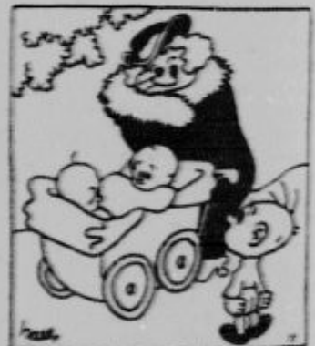
»Da je pa posebne vrste otrok? Tudi pri vsi tema imamo otroka, a naš ima glavo samo za eden komet.