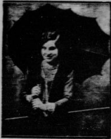
Novi tip deznika. Kar nam je že dolgo manjkalo, je novovrstni deznik, pri katerem ni pritrjena palica v središču, marveč ob strani. Deznik potem takem ne služi le eni osebi (in sicer na obeh straneh), marveč more odvarovati dve osebi pred dežjem. Lep pa tak deznik menda ne bo.