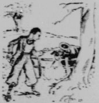
Letovodjar-vegetarijanec beži pred podivjano kravo: »Od danes naprej nisem več vegetarijanec, da bih videla, k Uria zemarna!« (Vegetarijanci se morda meca.)