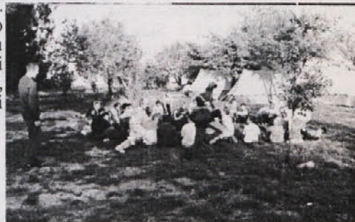
RJS Izola (V.Č.)

Po nočnem dežju, so naslednjega jutra po zajtrku najprej počistili prostor (pobrali papirčke in očistili ognjišče), nato pa zadovoljni odpravili domov !