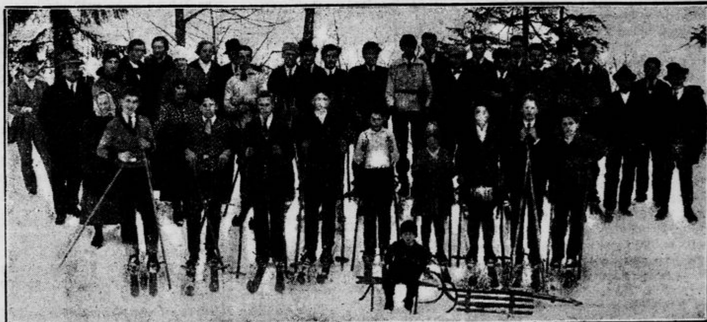
Vaški smučarji v Gorjah pri Bledu

Ljubljanski popoldanski brzovlak, ki pride v Karlovec okrog 17., je tik pred Karlovcem zaradi slabe proge skočil s tira. Strojevodja je nesrečo takoj opazil in vlak ustavil. Tako nesreča zaradi duhaprisotnosti strojevodje ni zahtevala nikakih žrtve. Promet je bil par ur ustavljen. Iz Karlovca so bili takoj odposlani na lice mesta delavci