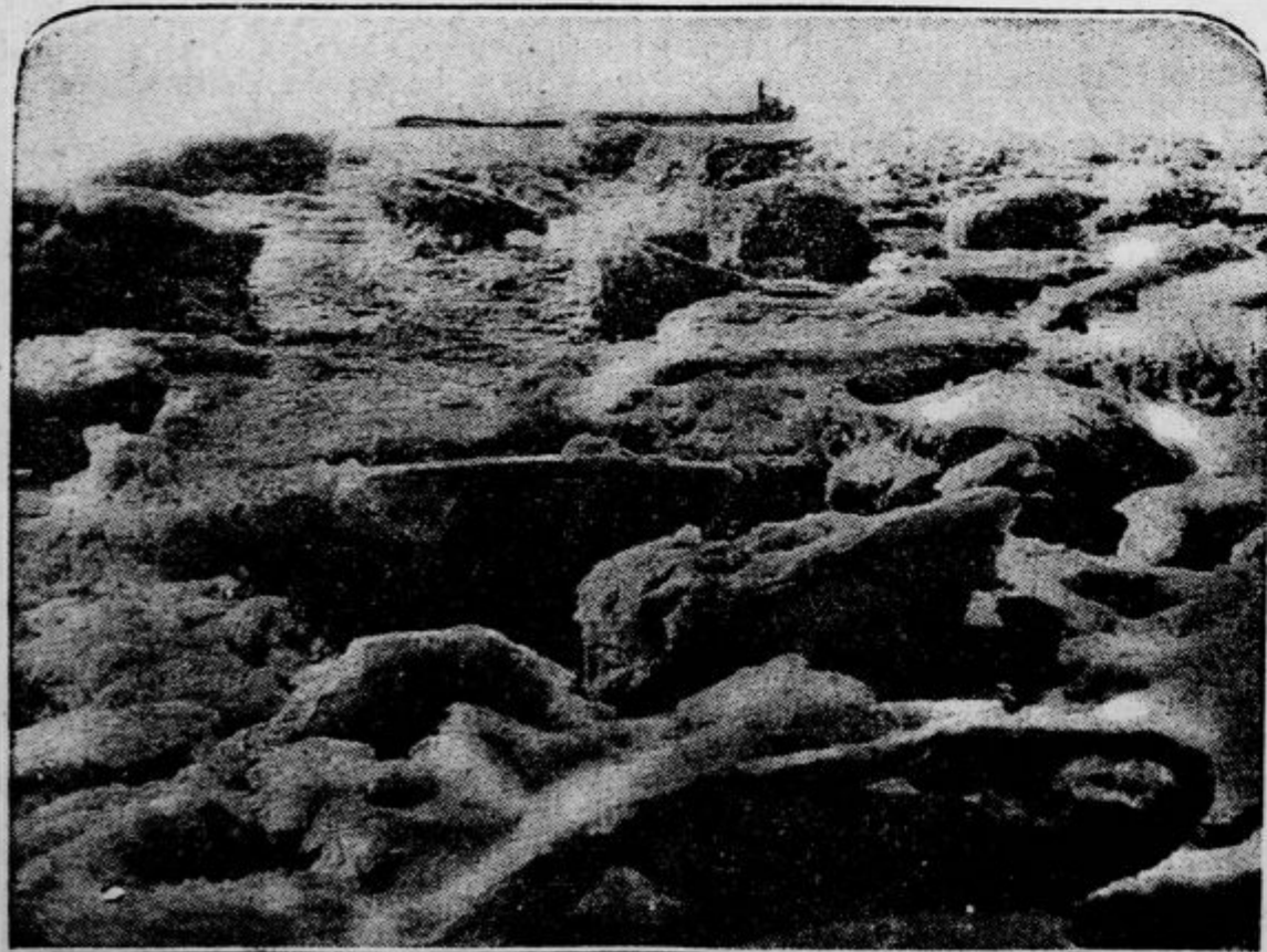
Antarktična pokrajina... v Osrednji Evropi Pogled na Labo, ki je v zadnjih mrzlih dneh ponekod zamrznila.