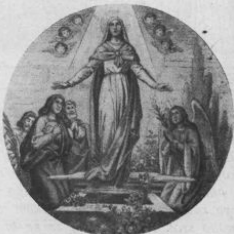
Ki te je, Devica, v nebesa vzeo.

Po Marijinom vnebovzetji se je včasi začelo njeno kronanje za Kralico nebe i zemle, posedovanje njenoga trona v najbližnji bližini presvetoga Trojstva, se je začelo njeno slavno kralüvanje skoz vekov veke. To je najvišije mesto skrivnosti, svetek vseh svetkov i prepunjena mera vsej krasot, šterih človek niti nemre misliti. Če mamó mi zemlaki kakše slavje na zemli, se to sploh nemre primerjati z nebeskov lepotov i krasotov. Vse je zapopadeno v reči, da je slavnostno vznebovzetje Marije božemi Sini, Gospodi vsej dik bilo spodobno. V nekom pogledi, kak trdijo, je bilo Marijino vnebovzetje še slavnejše kak Zveličitelovo; to pa zato, ar pri Jezušovom vnebovzetji nej bilo zraven Marije, ki je najlepše, najlübeznivejše i najvišije bože stvorenje. Boži Sin zdaj drugoč stopi v nebesko kralstvo, za roko držeč svojo lübleno mater, štera je prepojena s takšov radostjov, lübeznivostjov i čästjov, da vsi nebeski šeregi čüdeč i hvaleč zakričijo: „Što je ta, štera se zdigava s püstine i je naslonjena na svojega Lüblenoga?“ (Visoka pesem 8, 5). „Što je ta, štera vz-