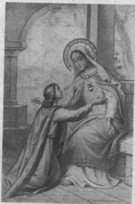
Marija, nebeska kralica, sprejmi naše duše na svoje materno srce.

— Vianney je nesposoben za faro, — so razglasili okoli. Trbe pa znati, da je bilo njegovo šolanje v detinstvi i mladosti prenaglo, pretrgano, večkrat zabrisano tak, da je to moglo meti nasledke za celo življenje. V kakših zmetnih prilikaj je on raseo, je tudi znano. Nieden duh najmre ne ostane brezi škode, či nikaj ne dela tá do dvajstoga leta.