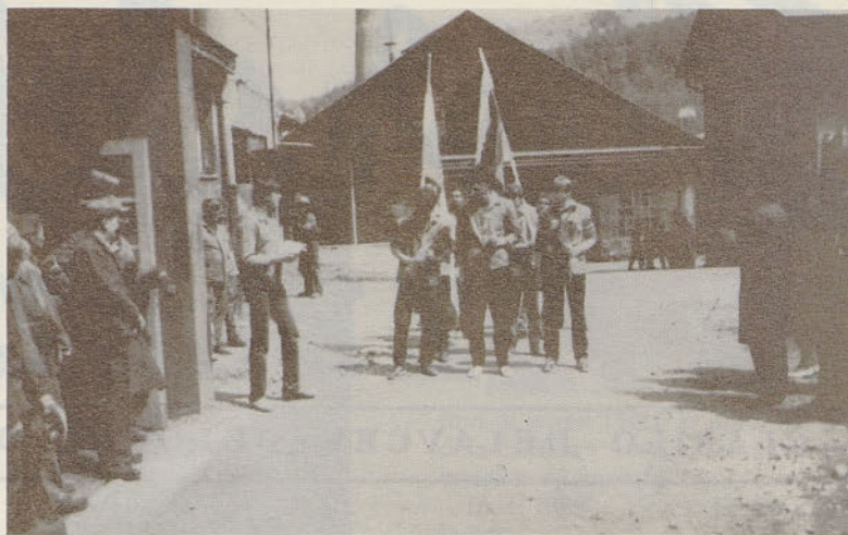
Štafeta mladosti pred Livarno I.

Srebrni znak zveze sindikatov Slovenije je prejela tudi osnovna organizacija sindikata TOZD Jeklarne. Ta osnovna organizacija si je vseskozi prizadevala za uresničevanje Gspodarskega načrta in s tem maksimalno angažiranost vseh sil znotraj TOZD na ustanovitev količinske proizvodnje in zmanjšanje materialnih stroškov. Zelo se je angažirala v samoupravno delovanje znotraj TOZD. Svoje delo je gradila na človeških