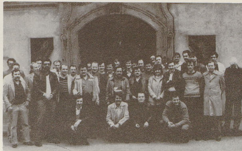
Udeleženci ekskurzije na Jesenicah

Analize potekajo po metodologiji za izdelavo strokovne dokumentacije, ki mora biti predložena zahtevi za določitev delovnega mesta, na ka-