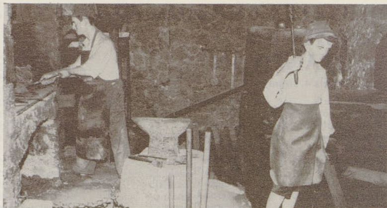
Detajl iz železarskega muzeja na Jesenicah