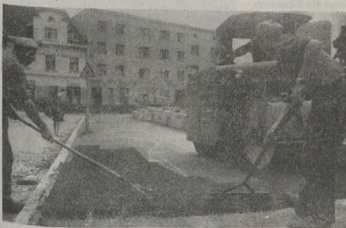
Asfaltiranje cest, parkirnih prostorov in pločnikov po Kočevju bo kmalu zaključeno