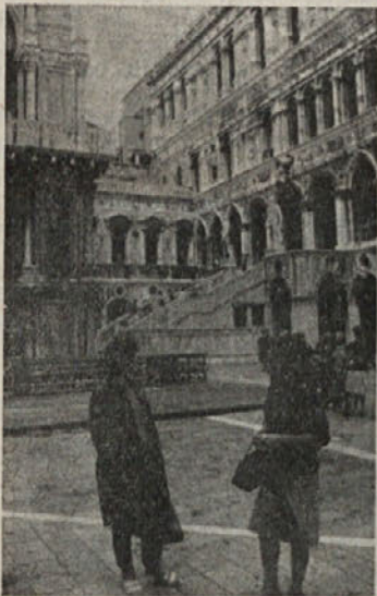
Na dvorišču Doževe palače

Ko se nam je v daljavi prikazal zvonik na Markovem trgu, smo se začeli nestrpnost presedati na sedežih, vodič pa je že razlagal, da se peljemo skozi zadnje večje mesto pred Benetkami, takorekoč skozi predmestje, Mestre, ki imajo svojih 180 tisoč prebivalcev, od industrije pa je najpomembnejša železarna ter tovarna orožja, kjer izdelujejo nam dobro znane »brede«.