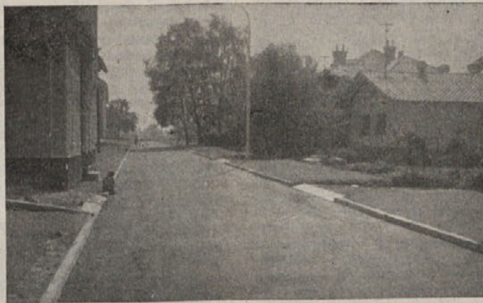
Prešernova cesta, ki pelje k Šeškovecu, je že asfaltirana

Nekateri kmetje pravijo, da je nujen večji odstrel, zmanjšanje staleža na minimum, drugi pa hudomušno pristavljajo, naj bi