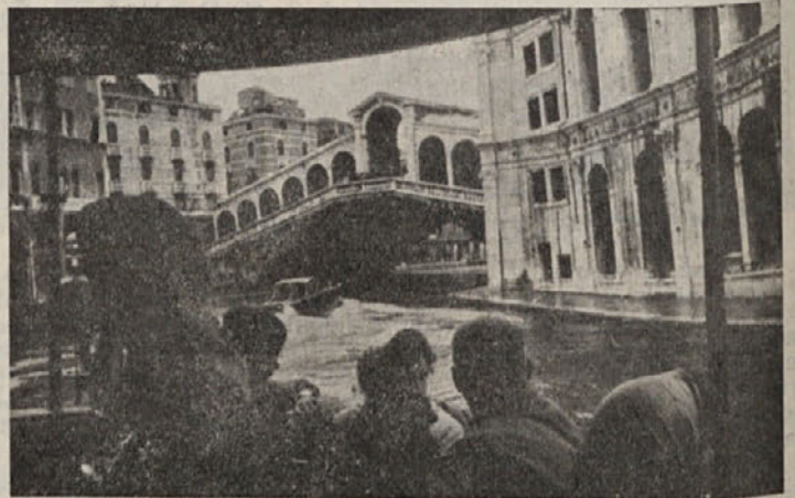
Na Canalu grade. Spreddaj most Ponte di Rialto