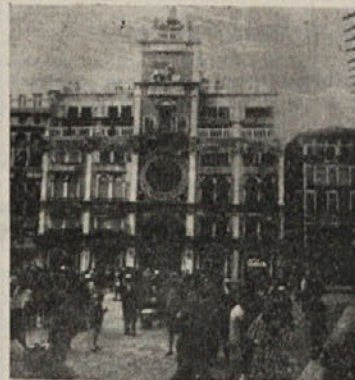
Markov trg. Vrh zvonika vidimo zvon in znamenita bronasta zvonarja

150 lir je kaj majhna odškodnina za bogat sprehod po Doževi palači. Pozoren obiskovalec bi lahko hodil ure in ure, morda