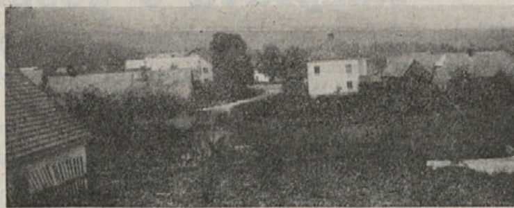
22. septembra so pripadniki predvojaške iz Ribnice in Koč. Reke ter vojak iz Ribnice ponazorili napad na plavogardistično postojanko v Grčaricah. Članek o tem na str. 4.

V borbi proti tuberkulozi je zdravstveni službi v veliko pomoč (Konec na 12. strani)