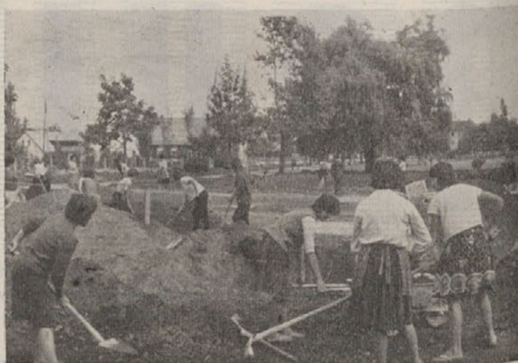
Gimnazijci so delali preteklo nedeljo pri domu telesne kulture...

— Pa še vprašal sem jih, če naj prinesemo lopate s seboj!