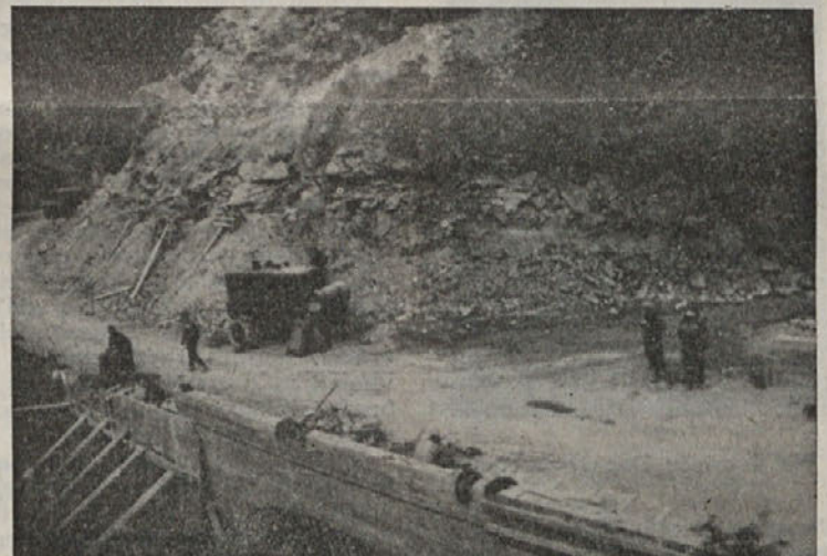
KOČEVSKA MAGISTRALA bo, tako zatrjujejo, gotova o pravem času. Ta teden bo dokončana cesta od Ribnice do Stare cerkve. Precej težav imajo med Ortnekom in Zlebičem. Na sliki: na ozkem ovinku pri Zlebiču bodo morali odstraniti del hriba

Sklenili so tudi, da je treba okrasiti vsa naselja ob cesti proti Kočevju, na praznik pa se morajo posebno skrbno pripraviti gostinci, kajti marsikdo se bo ustavil tudi v Ribnici. (vec)