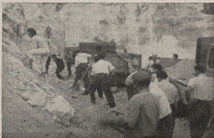
Eno glavnih delovišč prostovoljcev je bil mozelski peskokop

— Tudi šoferji, kljub napornemu delu v rednem delovnem času pri svojih podjetjih, z razumevanjem priskočijo na pomoč še popoldne in ob nedeljah, se pravi takrat, ko delajo prostovoljni delavci.