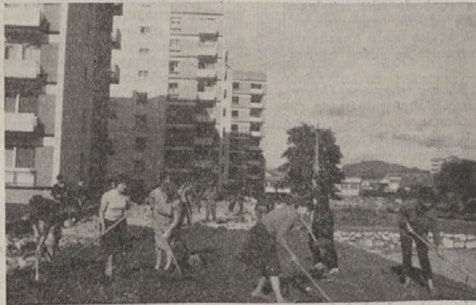
Predvsem po zaslugi prostovoljcev dobiva okolica stolpnice vsak dan lepšo podobo