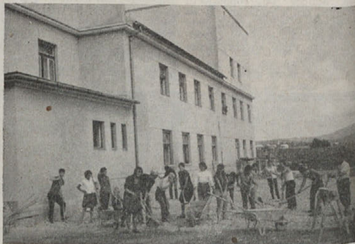
... pri Šeškovem domu in drugod