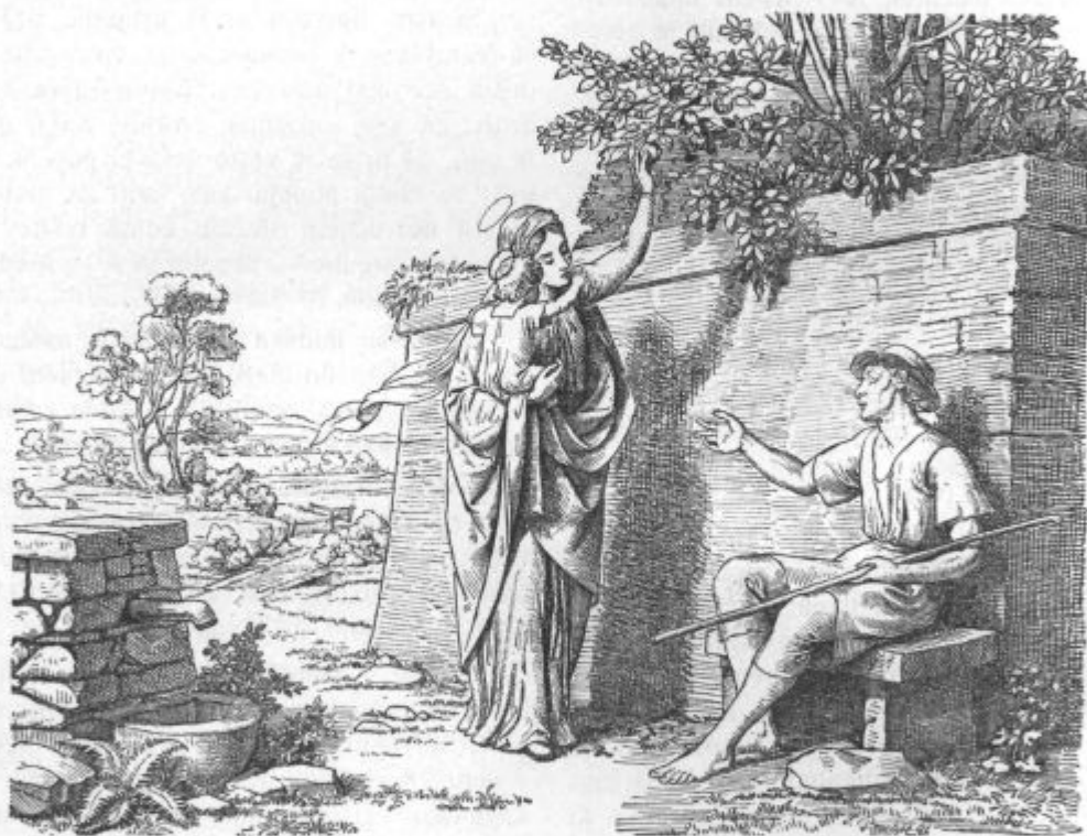
Na poti v Nazaret. (Po španski legendi.)

Pogumni telovadci. Po vseh župnijah, kjer imajo telovadne odseke, so telovadci na ta lepi praznik pristopili k skupnemu sv. obhajilu . To je gotovo nekaj posebno lepega in hvalnega! Ti