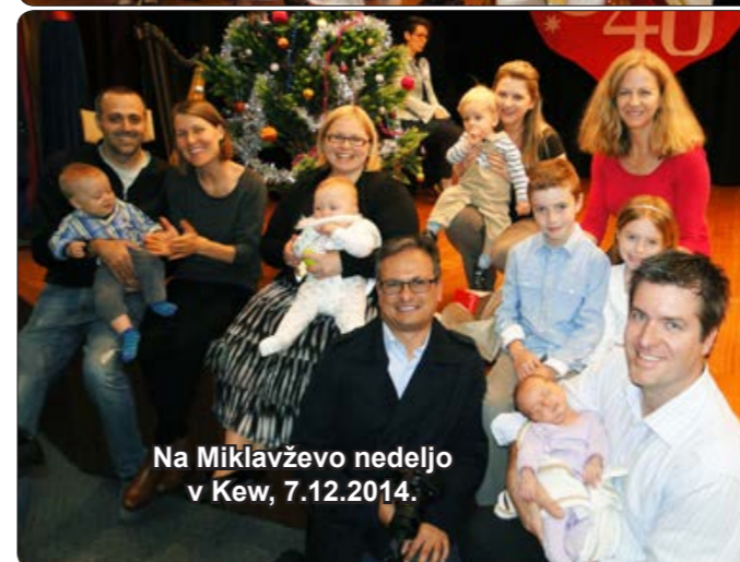
Na Miklavževo nedeljo v Kew, 7.12.2014.