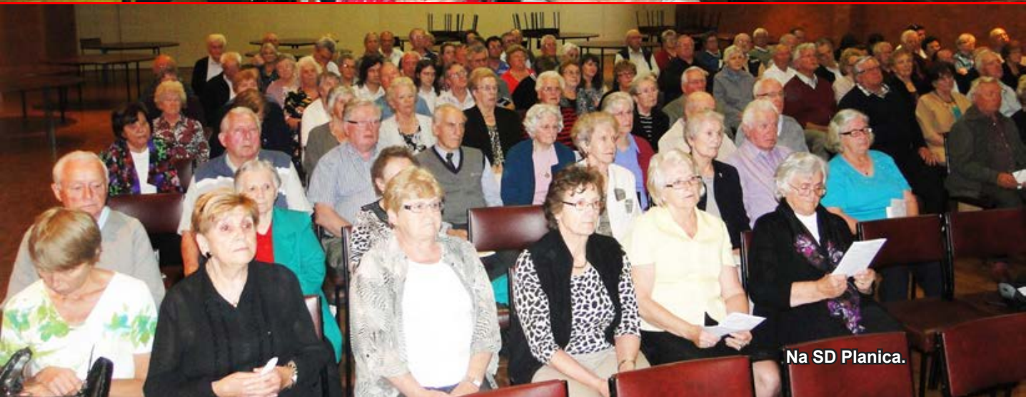
Na SD Planica.