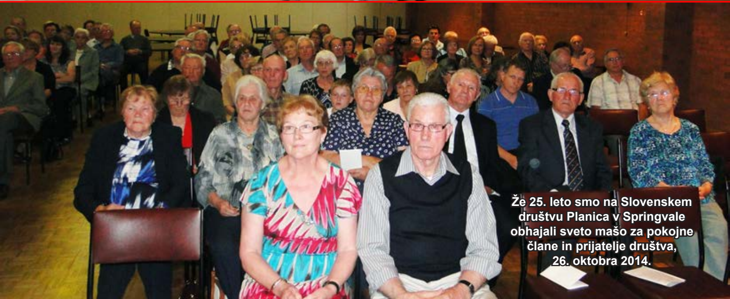
Že 25. leto smo na Slovenskem društvu Planica v Springvale obhajali sveto mašo za pokojne člane in prijatelje društva, 26. oktobra 2014.