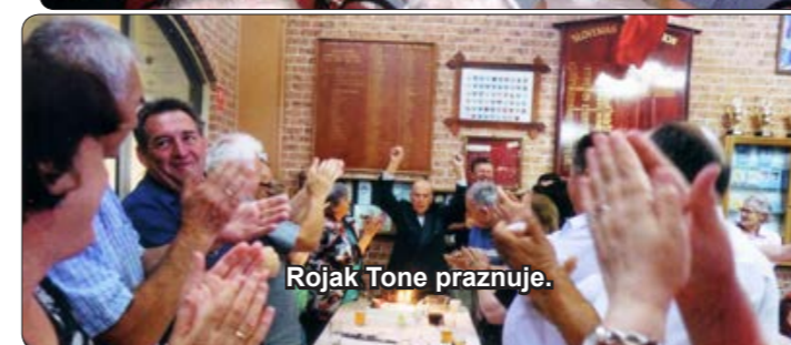
Rojak Tone praznuje.