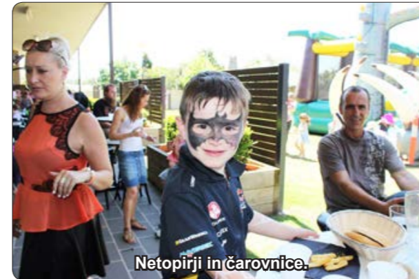
Netopirji in čarovnice.