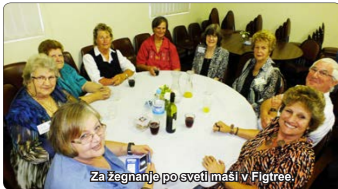
Za žegnanje po sveti maši v Figtree.