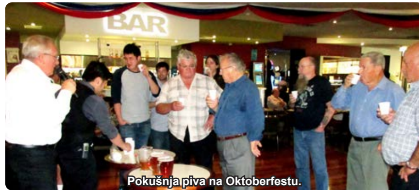
Pokušnja piva na Oktoberfestu.

V nedeljo, 16. novembra 2014, smo imeli MARTINOVANJE, dan, ko se ocenjuje mlado vino, ki ga po stari tradiciji pridelajo naši slovenski vinski strokovnjaki, zadnja leta pa so prišli na tekmovanje tudi klubske člani italijanskega rodu, ko so prav tako dosegli lepe uspehe na tem področju. Za