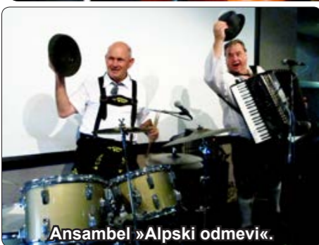
Ansambel »Alpski odmevi«.