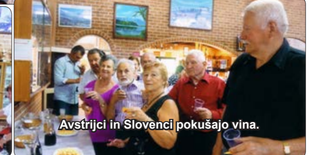
Avstrijci in Slovenci pokašajo vina.