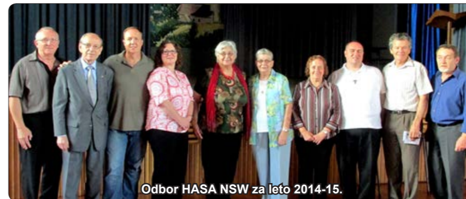
Odbor HASA NSW za leto 2014-15.