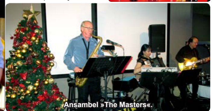
Ansambel »The Masters«.