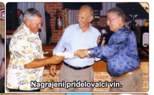
Nagrajeni pridelovalci vin.