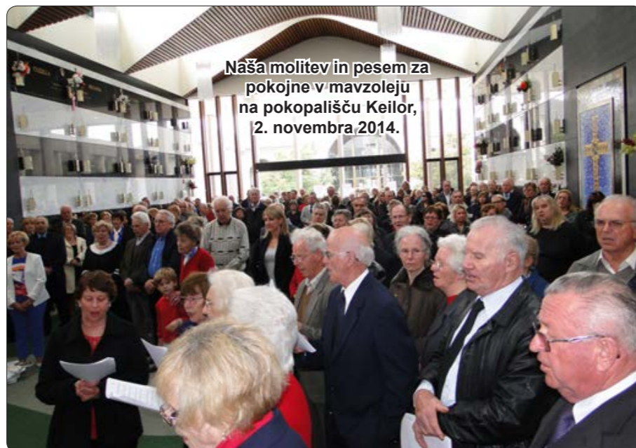
Naša molitev in pesem za pokojne v mavzoleju na pokopališču Keilor, 2. novembra 2014.