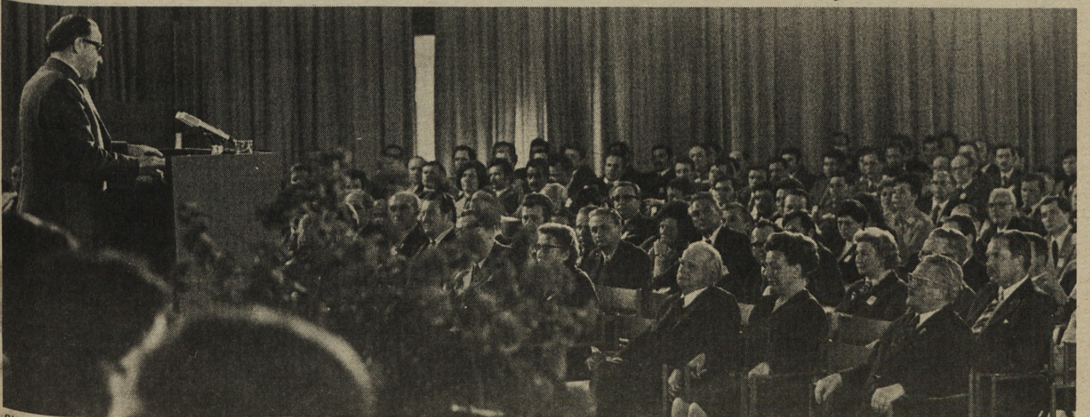
Sklepni govor na VII. kongresu Zveze komunistov Slovenije je imel France Popit, znova izvoljen za predsednika CK ZKS.