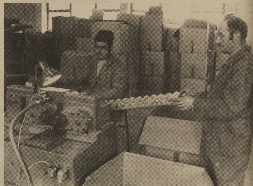
Kondenzatorji — Semič — vrezovanje navojev na lončke za kondenzatorje v novem obratu v Semiču. Kaj več bomo o tem, na novo organiziranem delu semiške proizvodnje spregovorili prihodnjic.

Tudi, če bi proizvodni načrti uspevali še naprej izpolnjevati normalno, je razumljivo, da bodo letošnji poslovni rezultati tovarne kaj skromni, saj omenjene podražitve in zaradi nerednih dobav materiala in naštetih vzrokov potrebno pogosto nadurno delo, sproti porabijo akumulacijo