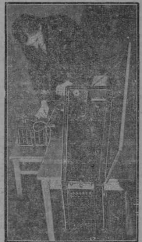
Aparat, s katerim je mogoče slišati na razdaljo 3000 km — od ruskega otoka Nowaja Semlja do Potsdama pri Berlinu.