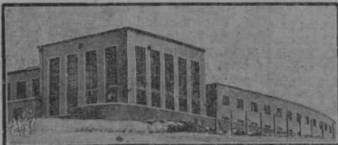
Najnovejša dunajska radio-oddajna postaja na Bisambergu.

Domač trgovec kupi od kmeta sadje prav po nizki ceni in ga proda z dobrim zaslužkom dunajskemu trgovcu. Dunajski trgovec ga zopet z dobrim zaslužkom proda holandskemu trgovcu v Amsterdam ali angleškemu v London in od tam še le sadje potuje, kamor je namenjeno. Tam ga sprejme predzadnji trgovec, ki ga razproda manjšim trgovcem in kramarjem. Ti ga še le razprodajajo na drobno. Ni čuda, da je pri nas sadje tako poceni in tam, kjer ga uživajo, tako drago, ker vsi ti trgovci si drago zaračunajo prevozne stroške in trud, povrhu pa še hočejo dobro zaslužiti. Neka vplivna oseba je pravila, da je bilo pri nas sa-