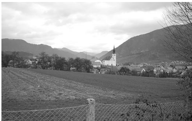
Pogled na vas Kovor danes.

Foto: Mojca Tercelj Otorepec, 3. 3. 2007