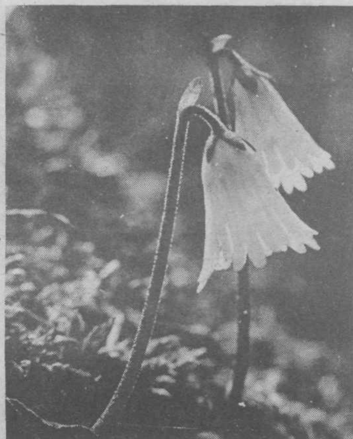
Odprimo pomladi ne samo okna in vrata, odprimo ji srca, podajmo ji roke, sicer bo šla mimo nas.

da nam ne bo treba v Ljubno, Luče ali Bovec, kjer bi si pasli oči nad urejenostjo. Zavijajmo rokave in dajmo priložnost pom-ladi, da se tudi pri nas razcve-ti. S. G.