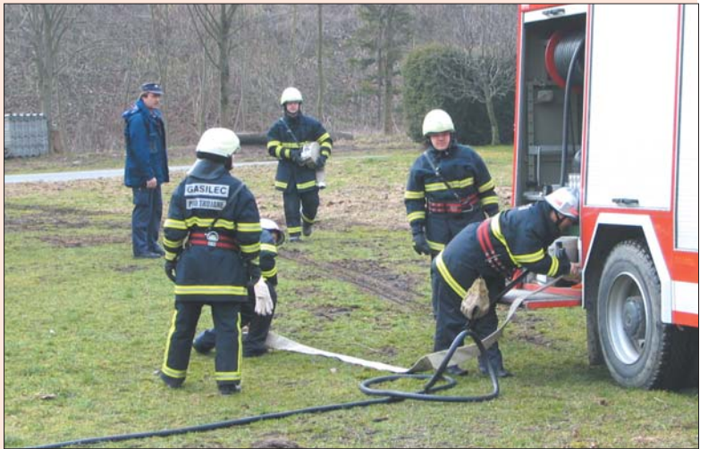
Postopno izvajanje vaje po skupinah

Izobraževanje gasilcev je prav gotovo temeljna naloga gasilske organizacije. Gasilska zveza Lukovica bo v skladu s pristojnostmi še v letošnjem letu organizirala tečaj za strojnike in tečaj za vodjo enote. K predlaganju kandidatov na omenjena tečaja in še nekatere druge vrste stalnega strokovnega izpopolnjevanja so bila prostovoljna gasilska društva že povabljeni.