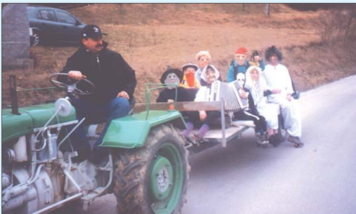
Pustovanju so se priključili tudi najmlajši Zlatopoljci

Tudi tokrat smo pričeli veselo pustovanje s prijateljsko nogometno tekmo v pustnih maskah. Ekipa Prevoj že dolga leta prihaja na pustno nedeljo v Zlato Polje, ker ob tekmi preživimo prijetne skupne trenutke. Prav tako je bilo tudi letos.