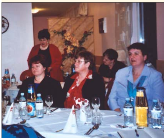
Občni zbor DPŽ Blagovica-Trojane