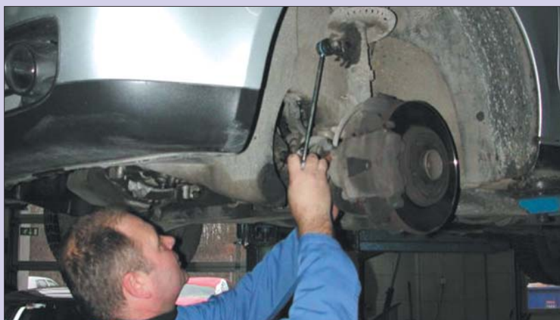
Poskrbeti je potrebno tudi za avtomobil

Zima, kakršna koli je že bila, se počasi poslavlja in s tem tudi čas zimskih gum na naših jeklenih konjičkih. Pri Avtu Cerar ob kamniški obvoznici so naredili še korak več. Poleg menjave zimskih za letne gume nas opozarjajo tudi na pregled vozila, kar pomeni veliko večjo varnost nas samih in ostalih udeležencev v cestnem prometu. Poleg vseh nasvetov za varno vožnjo, ki jih lahko dobimo od "mojstrov", lahko največ storimo, če svoje vozilo zaupamo pooblaščenemu serviserju, ki bo najbolje vedel, kako se stvari streže.