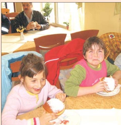
Kako so slastni