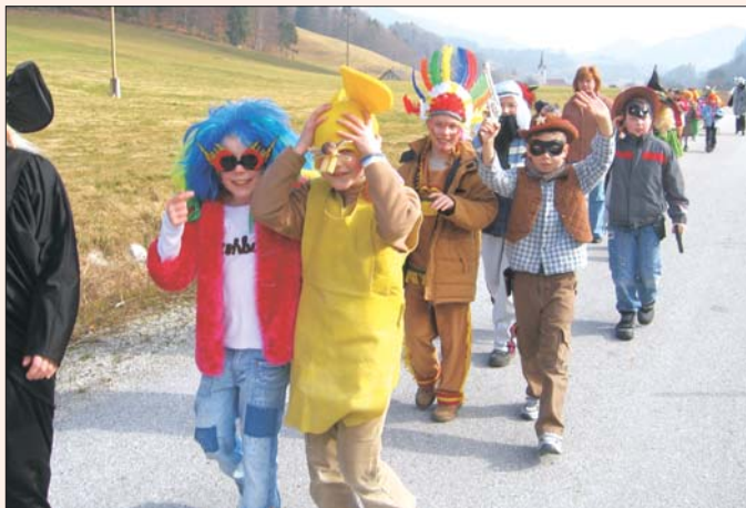
Pisan pustni sprevod