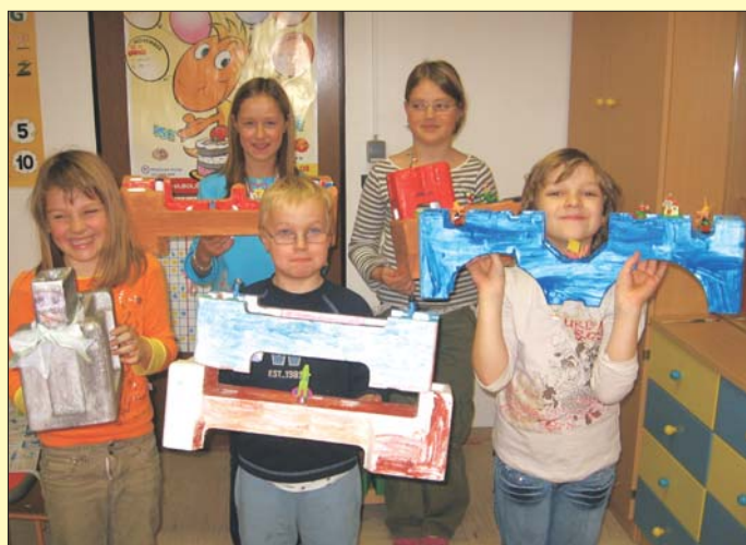
Izdelali smo svoje gregorčke

V Blagovici smo s cicibančki in njihovimi starši obujali star slovenski običaj - izdelovali smo gregorčke, ki se nato spuščajo po vodi na predvečer gregorjevega, ko se ptički ženijo. Gregorjevo je pravzaprav po starem koledarju prvi pomladni dan. Postaja vse bolj toplo in dnevi se daljšajo, zato so včasih v industrijskih krajih (Tržič, Kropa, Železniki ...) na predvečer spustili luč po vodi. Pozimi so delali ob luči, sedaj pa je ne bodo več potrebovali. Luč oziroma sveče so dali na lesene ladjice ali v jajčne lupine, ki jih je reka nato odplavila. V sodobnih časih pa izdelujejo ladjice iz različnih materialov in seveda najrazličnejših oblik. Nekateri so v tem že pravi mojstri in to so potrdili tudi vsi, ki so jih oblikovali v cicibanovih uricah in pri ustvarjalnih delavnicah. Prepričajte se tudi sami.