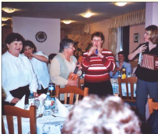
Ansambel “Bojte se nas” je veselo popestril srečanje.