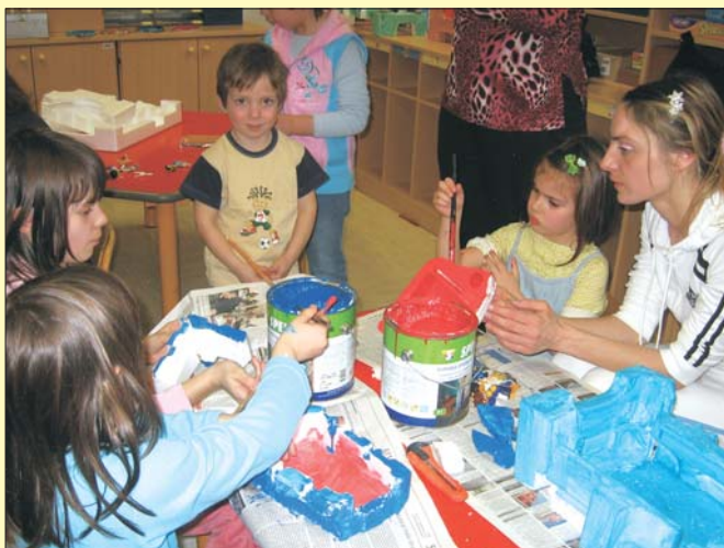
Tako so nastopali naši gregorčki