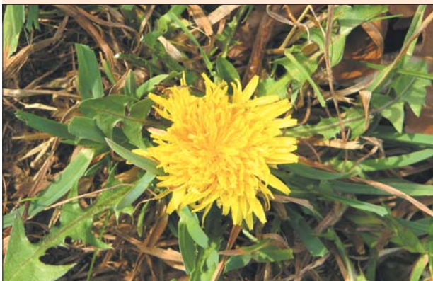
Celo februarja je bilo mogoče najti že prve regratove cvetove!

Letošnja topla zima je naravo dobro zmedla. Nič čudnega, da lahko regrat v naših krajih nabiramo že od konca februarja! Neobičajno darilo narave velja izkoristiti, saj je regrat nadvse uporabna rastlina. Še posebno prav pride spomladi, da po dolgi zimi prebudi življenjske sile organizma.