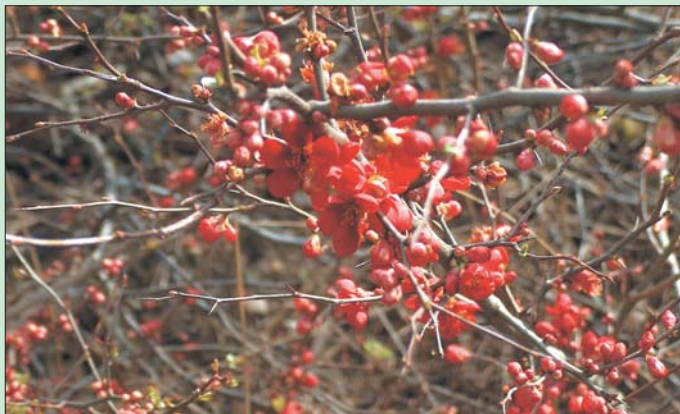
Okrasna japonska kutina

V tem mesecu čaka vrtnarje veliko dela pa tudi veliko zadovoljstva.