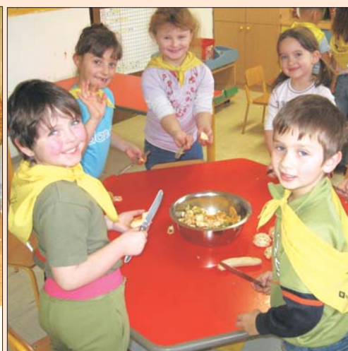
Tudi mi znamo