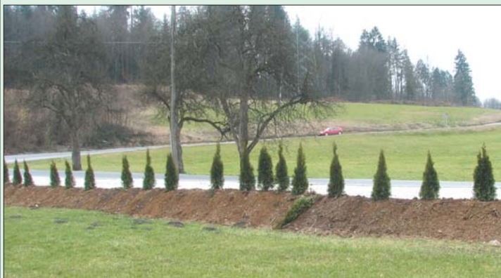
Komu so bile v napoto ciprese?

V Rafolčah je od lanskega letanogometno igrišče, v katerega krajani krajevne skupnosti in člani športno turističnega društva vlagajo veliko sredstev in prostega časa. Poleg igrišča je urejeno parkirišče, ob katerem je bil v lanskem letu pred zimo posajen nasad cipres. Žal pa je ta od konca februarja precej osiromašen, saj so v noči s 27. na 28. februarja nepridipravi izruvali in odpeljali neznano kam 30 cipres ter s tem KS Rafolče kot investitorja oškodovali za skoraj 500 evrov. Člani ŠTD Rafolče, ki so s prostovoljnimi delovnimi urami posadili ciprese, so ogorčeni, kot pravijo, je občutek slab in razumljivo, prisotna je tudi jeza. Krajani pa so predvsem razočarani nad takimi dejanji, ki družbi zagotovo niso v ponos. Tisti, ki so še posebej aktivni pri delovanju in urejanju nogometnega igrišča, pa vsi v en glas pravijo: „Ne bomo se dali, kupili in posadili bomo nove ciprese, ki bodo še lepše.“