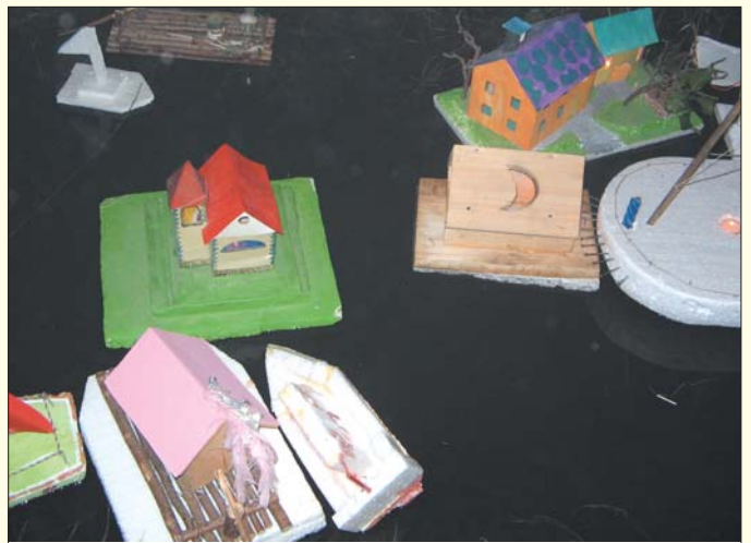
Večer popestrijo domiselno izdelana razsvetljena plovila.

Zvečer pride težko pričakovani trenutek, ko drobne lučke zaplavajo po vodi in vsakdo s pogledi spremlja svojega "gregorčka" in z njim potuje do tam, do koder pač gre.