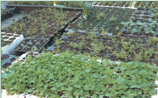
Proizvodnja različnih sadik

Na splošno je april mesec, ki se ga vrtnarji najbolj razveselijo. Marca, ko gledamo naravo okoli sebe in utrujeni vrt, kar težko verjamemo, da bo še kdaj kaj ozelenelo. Aprila pa se že prepričamo, da bo. Niti muhasto vreme ne more več ustaviti odganjanja mladih poganjkov in odpiranja cvetov. Spremenljivosti aprilskega vremena ni treba posebej opisovati, saj je bilo aprilsko vreme tako že v srednjem veku ali celo prej, ko so nastali številni pregovori o aprilu. Pri vrtnarjenju boste tudi sami kmalu spoznali, zakaj se pravila o aprilskih kmečkih opravilih še vedno prenašajo iz roda v rod. Aprila boste morali večino načrtovanih opravil prilagajati vremenu. Zato je treba aprila vedno poslušati vremensko napoved in opazovati spremembe na nebu. Zdaj se odločamo o vsem, kar se bo dogajalo v naslednjih mesecih, kaj in kje naj raste, cveti in zori.