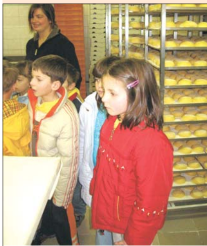
Kako nastane krof?