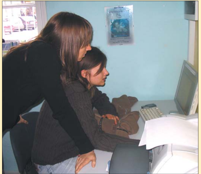
Dogajanje v klubu