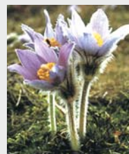
Velikonocnice letos prehitevajo

Vsem občanom voščimo lepe in blagoslovljene velikonočne praznike!