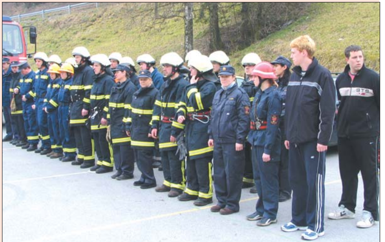
"Dobri smo bili!"