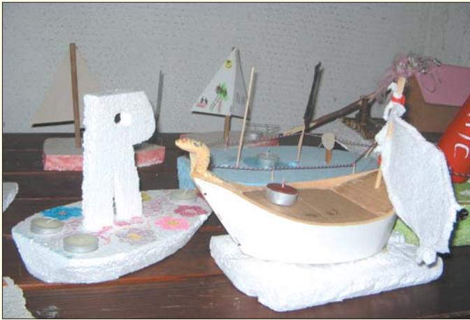
Razstava gregorčkov v OŠ Krašnja.