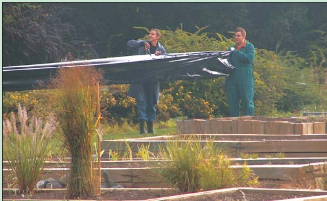
Priprava gred za sajenje