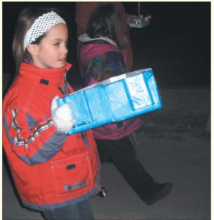
Male umetnije na poti do bližnjega potoka

Običaj je bil znan vse do Cerkelj, Šentvida in Domžal, pa tudi v Železnikih, KamniGorici in Kropi, zato predvsem v teh krajih že tradicionalno obujajo spomin na ta več sto let star običaj, s katerim proslavljajo bližajoči prihod pomladi. Običaj so v preteklih letih na veselje otrok pogosto oživili tudi v Krašnji (posnetki so izpred dveh let). Pri spuščanju domiselno izdelanih ladjic radi sodelujejo predvsem šolarji, ki kar tekmujejo v izvirnosti pri izdelavi svojega "gregorček". Iz lepenke, deščic, stiroporja ... izdelajo najrazličnejše hišice, okenca oblepijo s tankim barvnim papirjem in jih pritrdijo na deščice. Vanje položijo goreče svečke in jih spustijo po vodi. Preden pa jih spustijo po potoku, pa jih tudi razstavijo in včasih se na njih znajde še kakšno darilce.