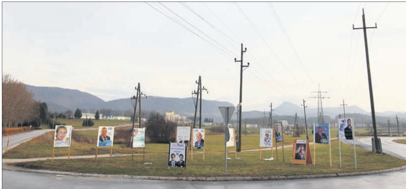
Izbira kot v supermarketu – same »super znamke« - z volilnim popustom.