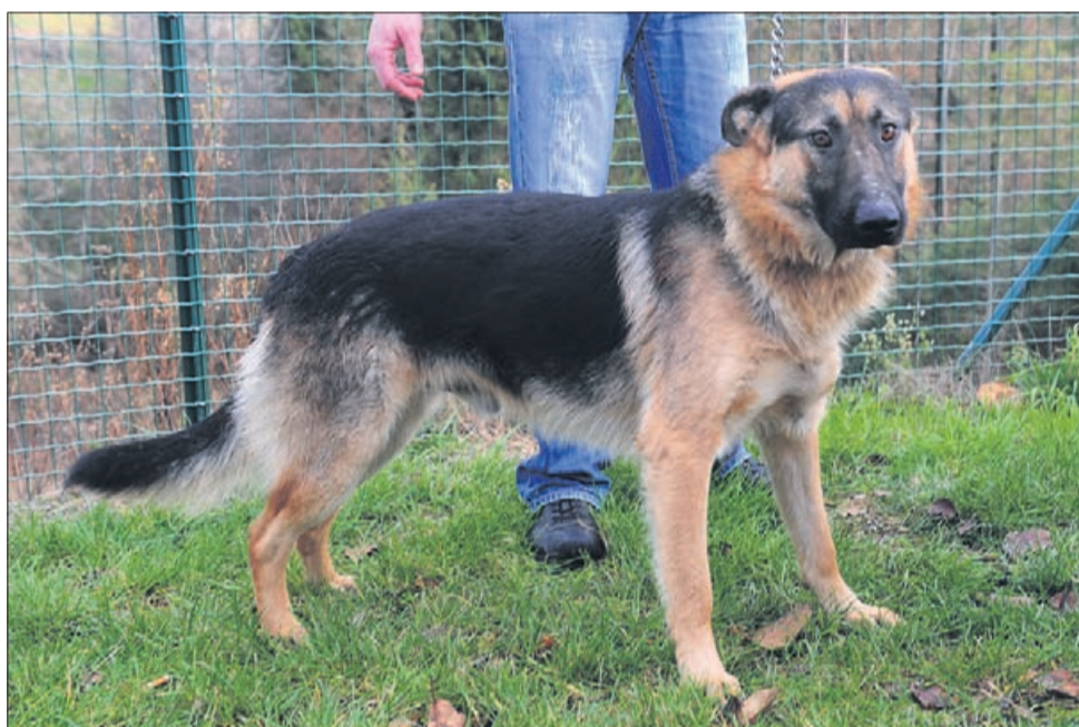
Rex je večje rasti, star eno leto, prijazen in ubogljiv.