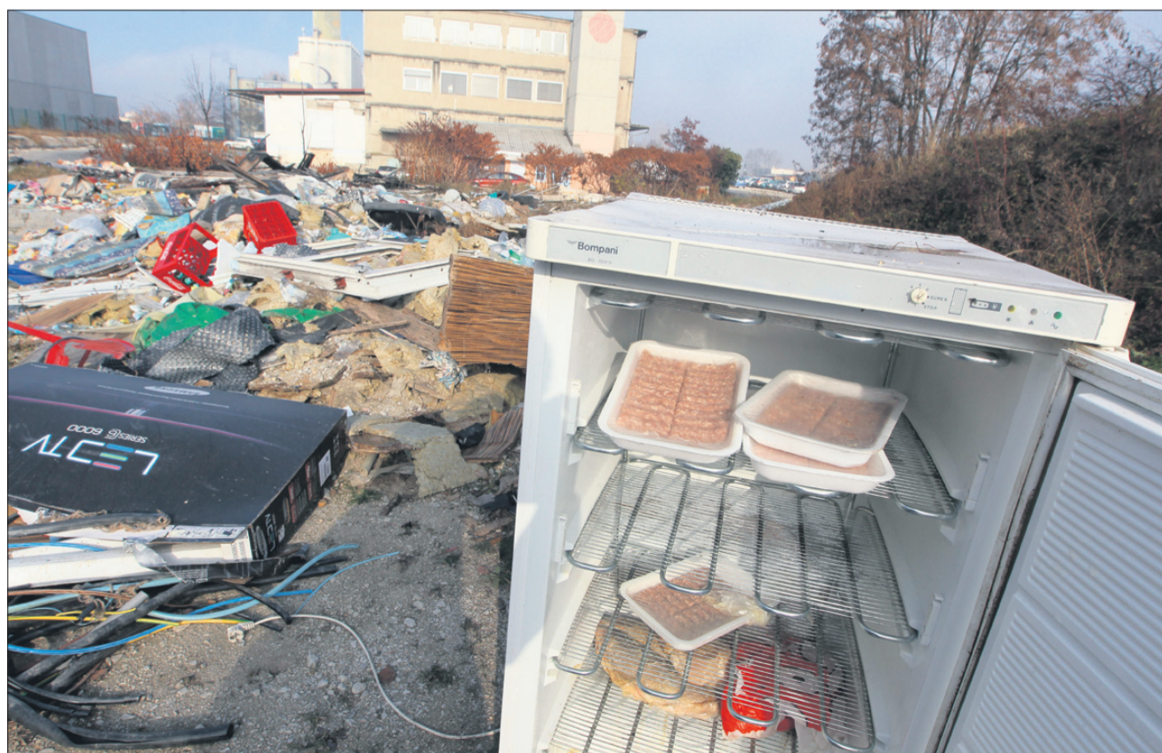
»Čevapdžinica« na obrobju mesta