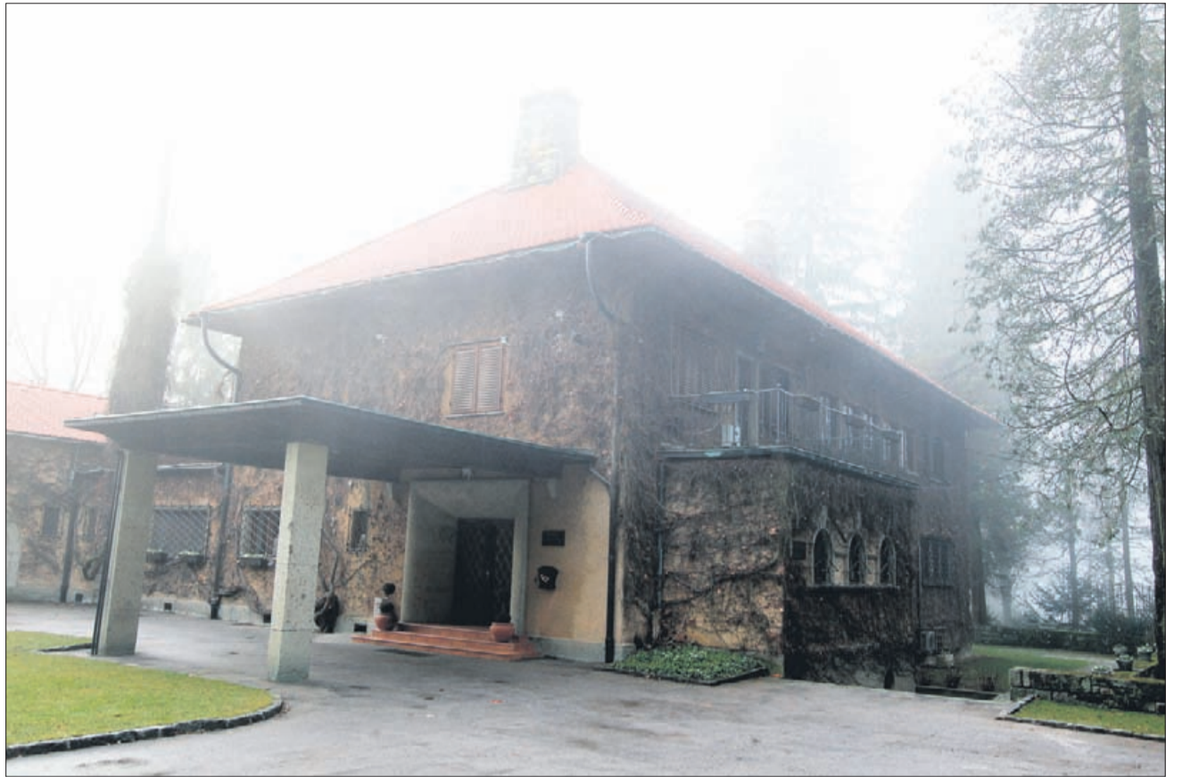
Vila Široko bo postala vrhunski hotel. Ker gre za eno redkih primestnih vil, bodo tudi v hotelu skušali ohraniti stik z naravo. Celotno območje vile, kjer bodo tudi stanovanjske hiše in športni park, naj bi postalo okoliš z najvišjo dodano vrednostjo v Šoštanju.

Celotno območje Vile Široko zajema še gradnjo stanovanj-