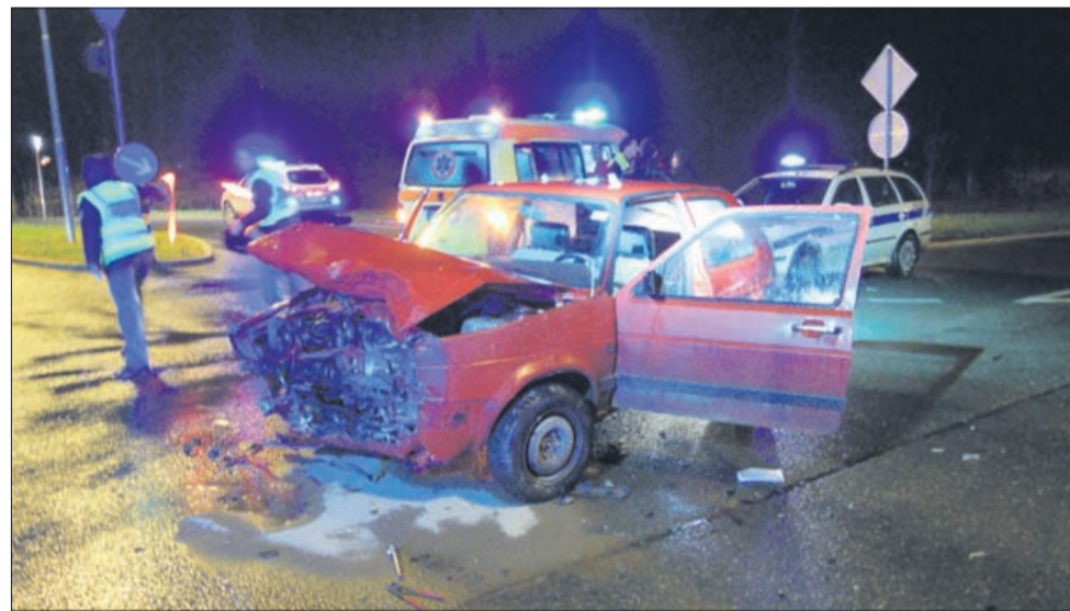
Sobota. Žalec.

Na obvoznici v Žalcu se je v soboto, nekaj minut po 18. uri, zgodila hujša prometna nesreča. V trčenju dveh osebnih vozil v križišču obvoznice proti avtocesti in stari cesti za Celje sta se poškodovali dve osebi. Poleg reševalcev so morali prvo pomoč nuditi tudi celjski poklicni gasilci.