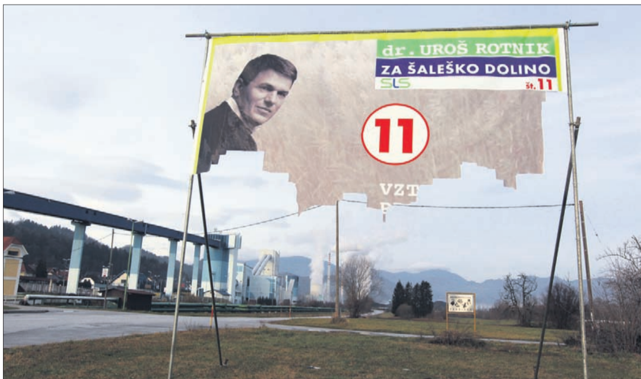
Rotnik pred Tešem