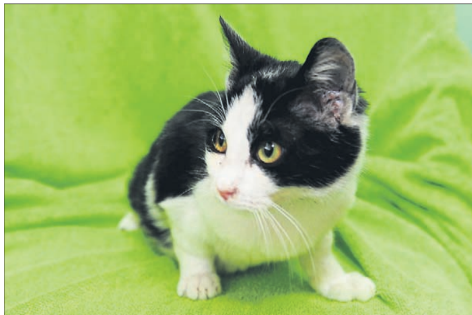
Muki je star osem mesecev, prijazen in igriv.

Uradne ure zavetišča Zonzani: od ponedeljka do petka od 8. do 16. ure; ogledi psov od ponedeljka do petka od 12. do 16. ure. Telefon: 03/749-06-00; internetni naslov www.zonzani.si .