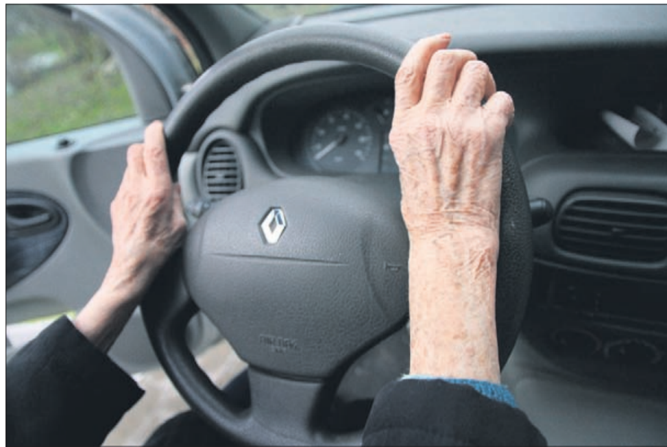
Lahko 80-letnik odreagira pravočasno?

V Sloveniji je veliko preventivnih akcij, namenjenih varnosti v prometu, vendar stro-