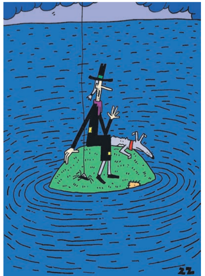
Mož, pes in pajek