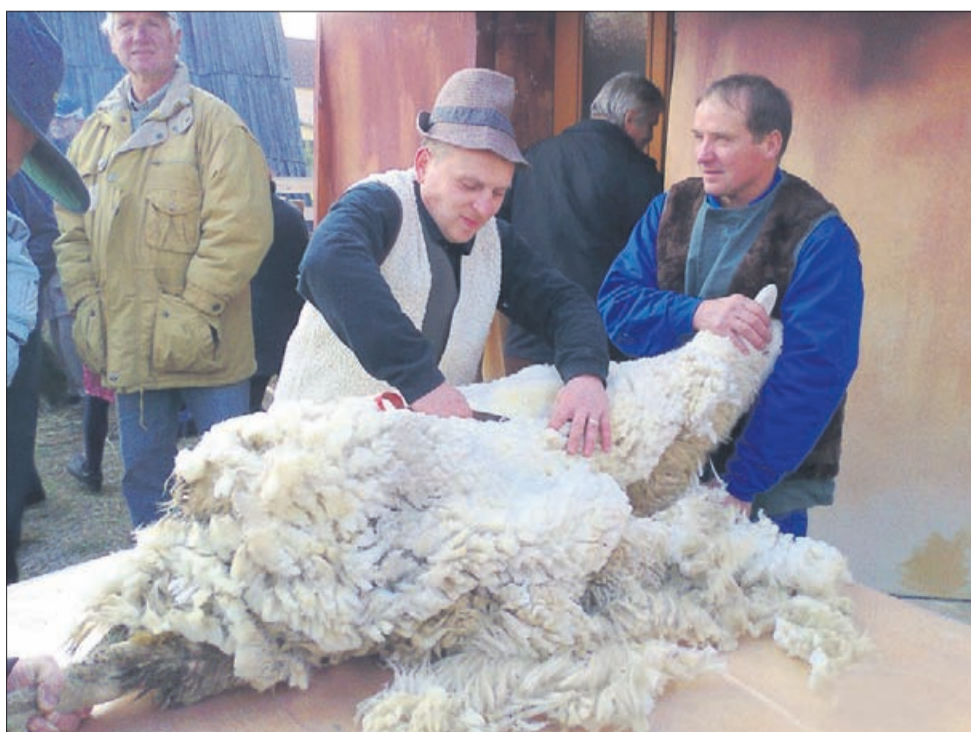
Striženje ovac na prireditvi Martinova sobota v Šmartnem ob Paki