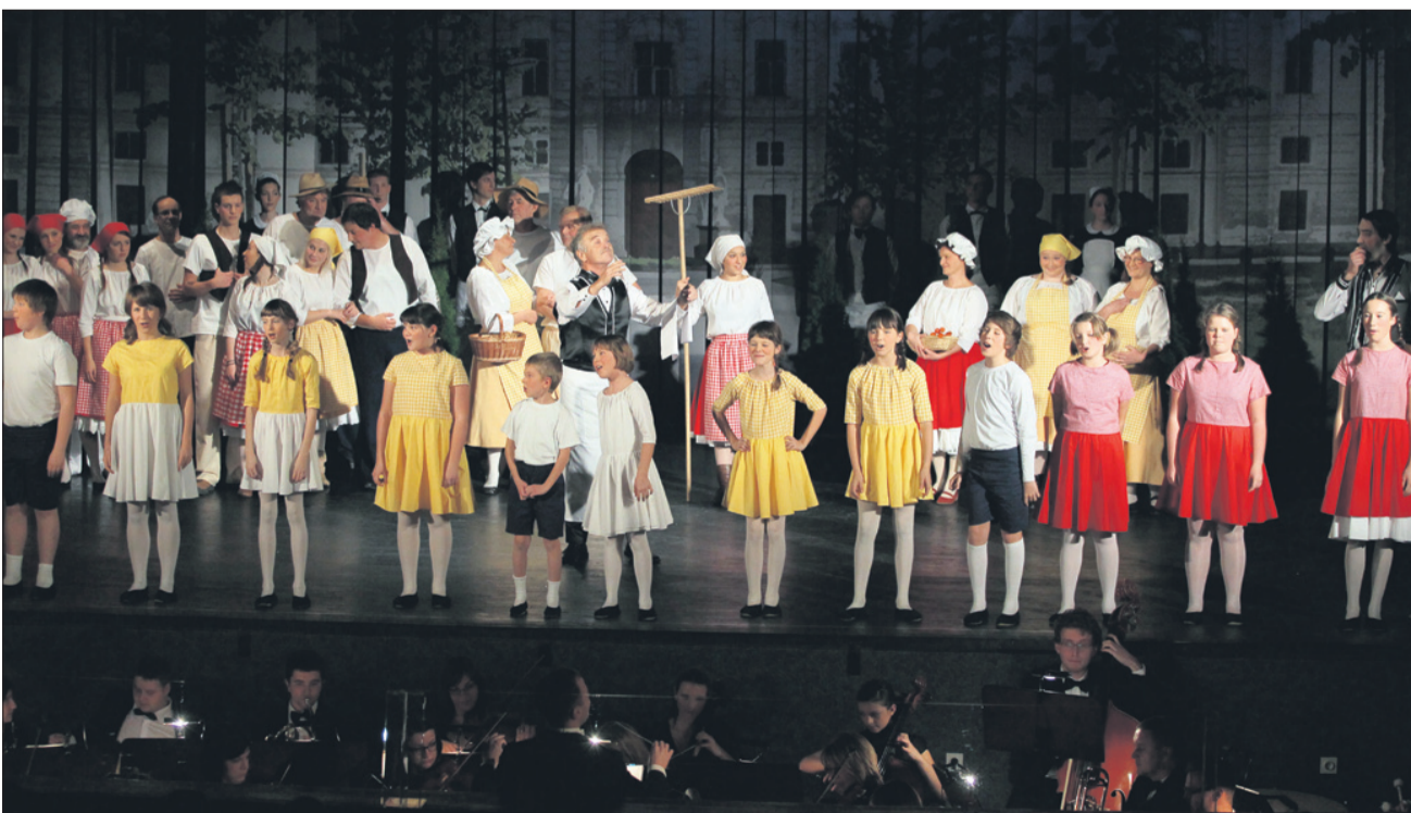
Tudi najmlajši so zapeli, zaplesali in zaigrali na odru Doma II. slovenskega tabora Žalec.