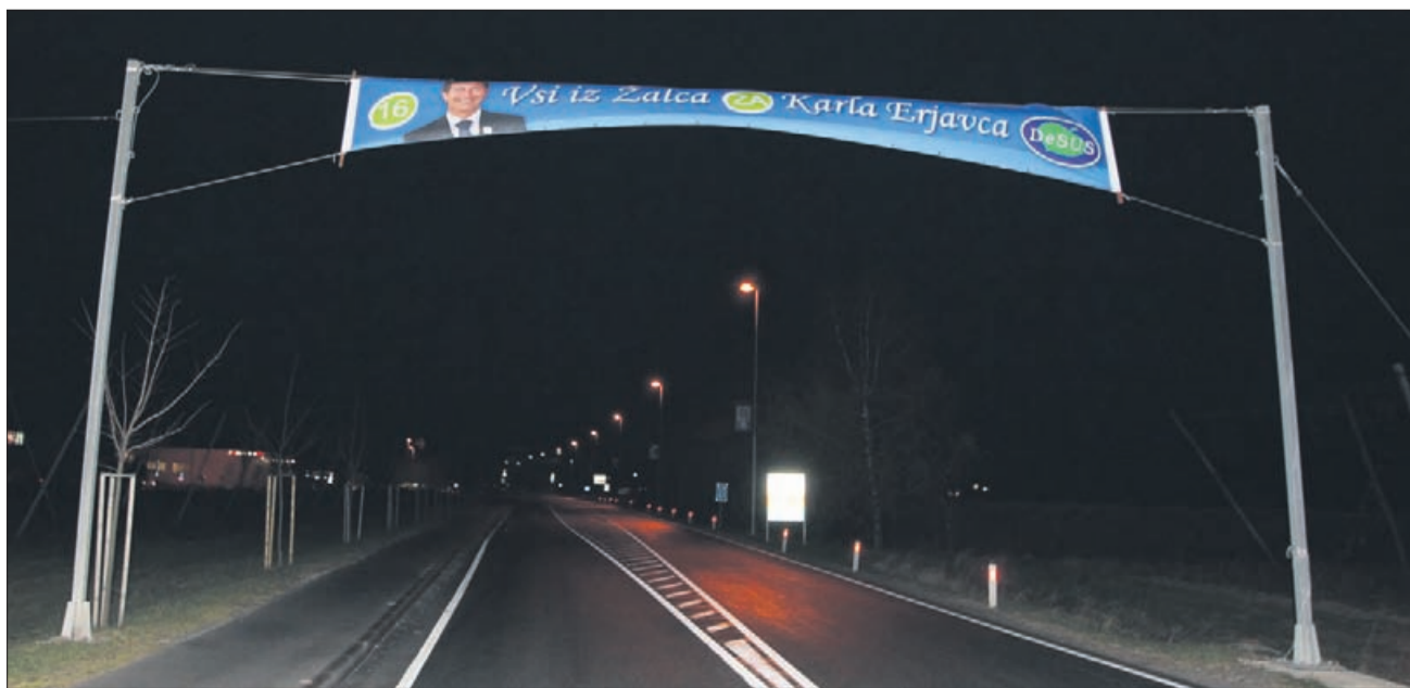
Vsi iz Žalca ZA ...