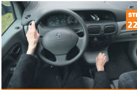
Je pri devetdesetih za volanom še varno?