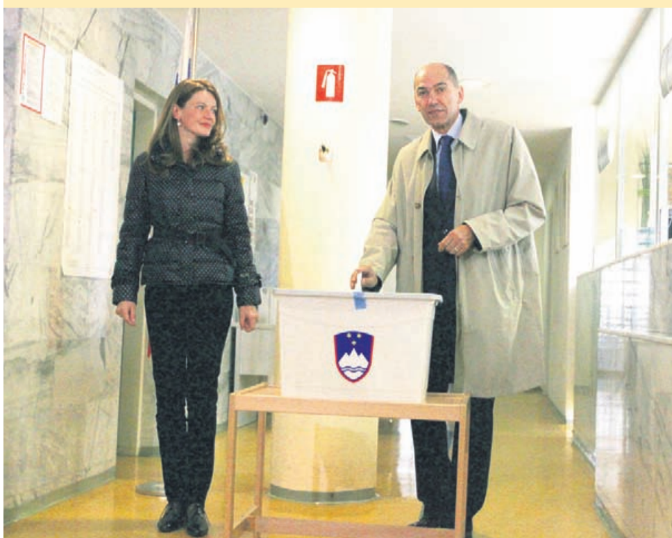
Kljub drugačnim rezultatom v državi ostaja na Celjskem zmagovalna stranka SDS. Njen predsednik Janez Janša je s soprogo Urško tokrat prvič glasoval na volišču v Velenju.