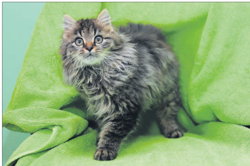
Neža je prijazna in igriva štirimesečna muca.