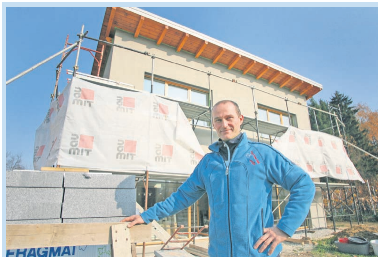
Med našim obiskom so v notranjosti hiše skrbeli še za zadnje podrobnosti, zunanosti pa je manjkala še fasada. Oboje je danes že končano.