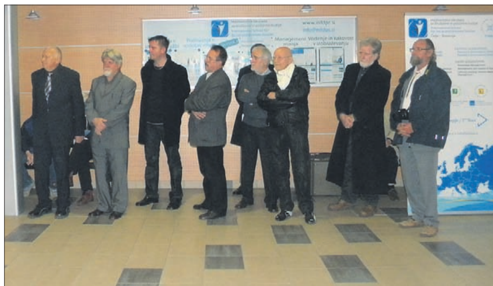
Skupina Pro tempore razstavlja v prostorih Fakultete za logistiko.