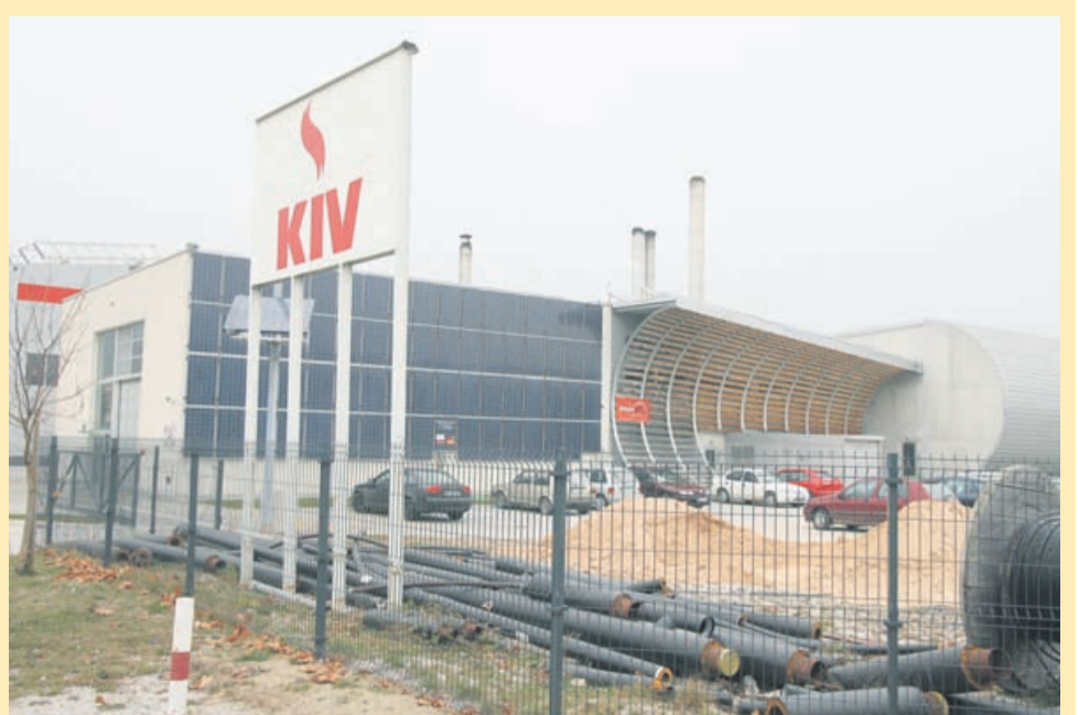
Sončna elektrarna je edinstvena v Sloveniji, saj je sestavljena iz vseh treh tipov – stacionarnega na strehi (pod kotom 30°), dela na fasadi (90°) in sledilne enote na parkirišču.

V okviru projekta Slovenija znižuje CO 2 je Umanotera letos izbrala 15 slovenskih in 5 tujih dobrih praks, ki pomembno znižujejo izpuste CO 2 ter hkrati prispevajo k uveljavitvi načel trajnostnega razvoja. Vranksko je bilo uvrščeno med pozitivne primere v kategoriji energetika – obnovljivi viri energije. V to kategorijo so kot primer dobre prakse uvrstili tudi Združenje slovenske fotovoltaične industrije, ki ima sedež v Latkovi vasi.