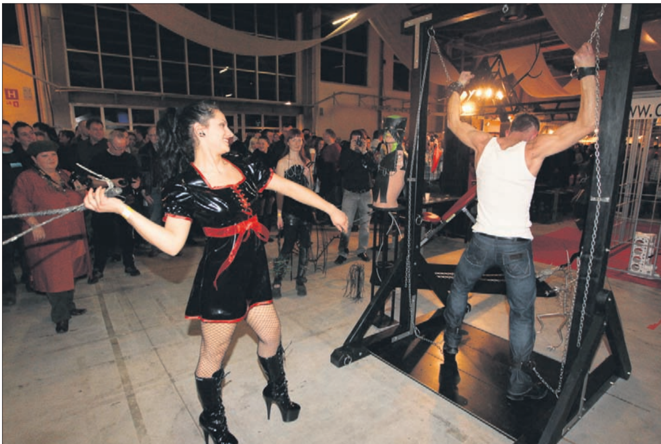
Takole pestro je bilo denimo lani.