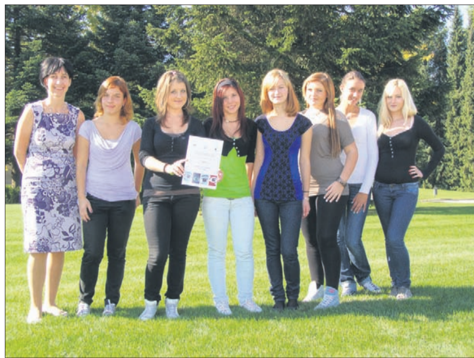
Dijakinje z ekokoordinatorico