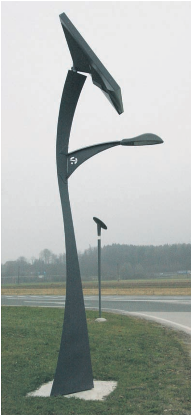
Obcestna razsvetljava deluje na sončno energijo.