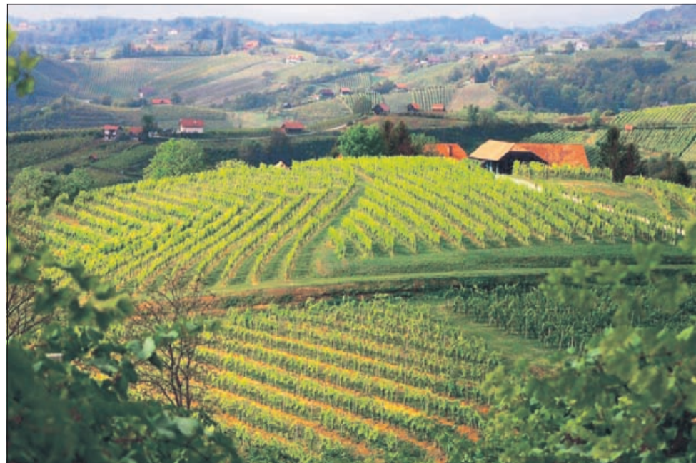
Prvonagrajena fotografija Leje Babič prikazuje vinogradniško pokrajino.