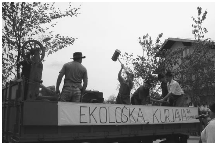
V Svetincih prisegajo na ekološko kurjavo