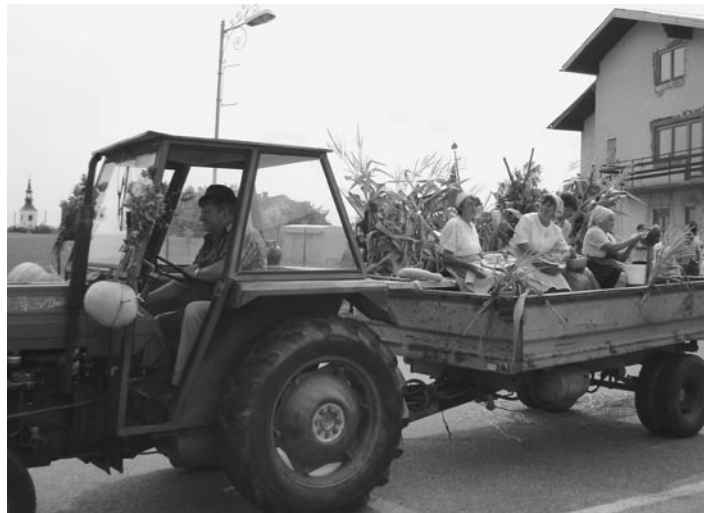
V Vintarovcih so trebili buče