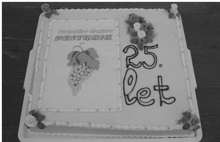
Torta ob jubileju

V nedeljo, 20. avgusta, je na Destrniku potekal tradicionalni 25. kmečki praznik, ki ga vsako leto organizira Turistično društvo Destrnik. Člani društva so že v soboto pri turističnem domu postavili klopotec in ob jubileju razrezali torto.