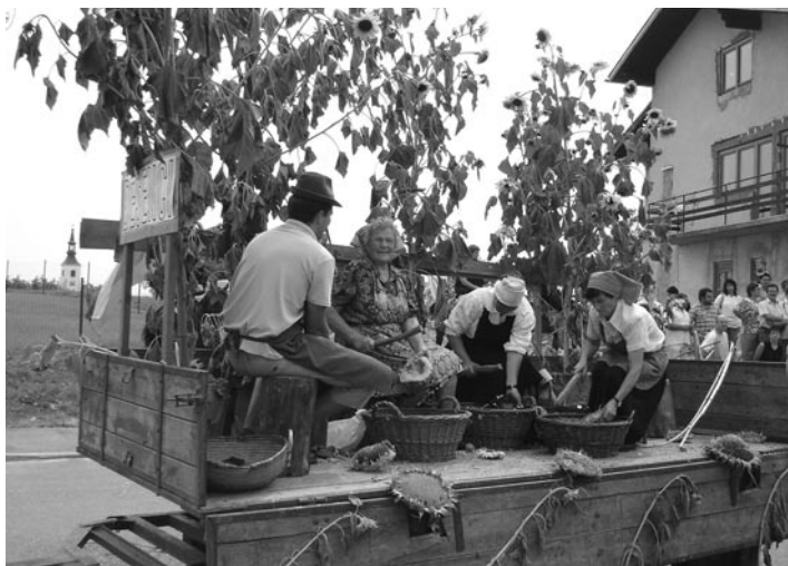
»Klopfanje sončnic« v Desencih