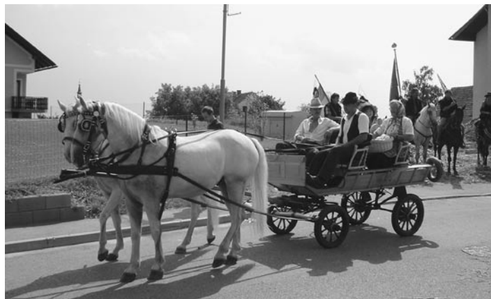
V Zg. Velovleku so se včasih vozili v Varaždinske toplice, sedaj se bodo pač v Terme Urban