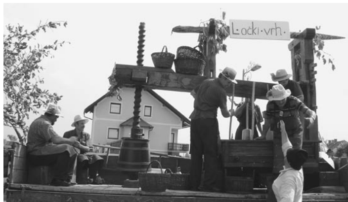
V Ločkem Vrhu so »prešali« jabolka