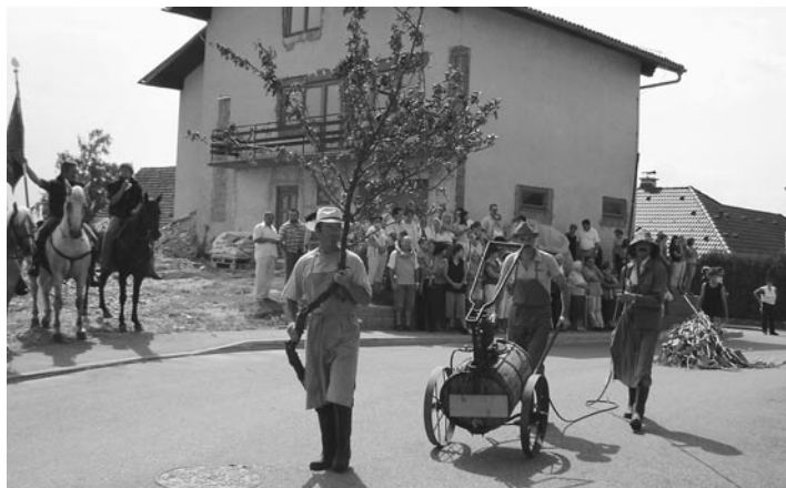
Gomilčani so nas »pošpricali po domače«

Nedeljsko praznovanje se je pričelo s prikazom starih kmečkih običajev. V mimohodu se je predstavilo šestnajst skupin. Najprej se je predstavila konjenica iz Zg. Velovleka, nato konjska vprega iz Destrnika, krajanji Gomilcev so prikazali opravila na