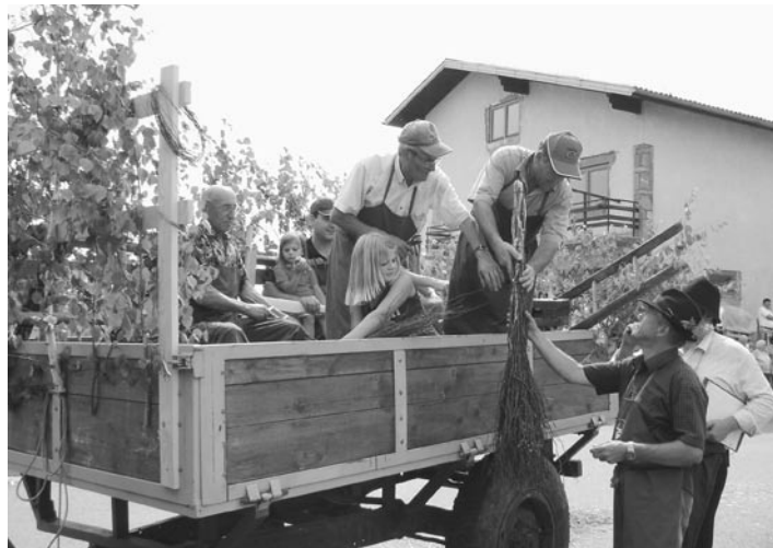
V Janežovskem Vrhu so izdelali brezovo metlo posebej za župana