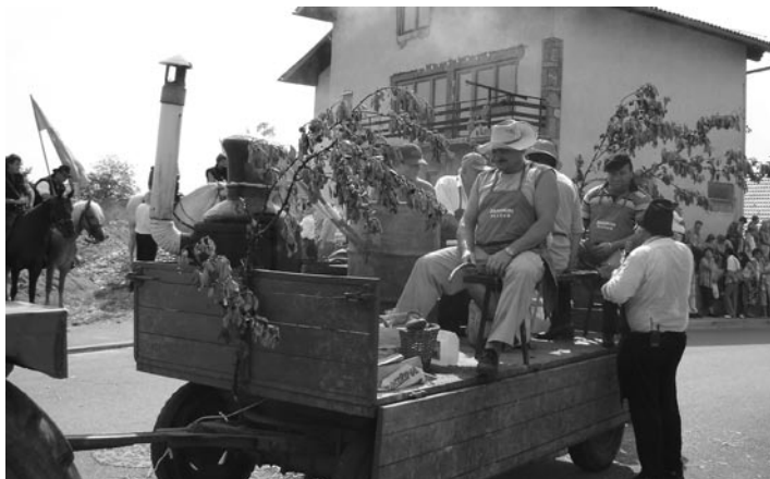
»Šnops« ne sme biti premočen Občan - 13. september 2006