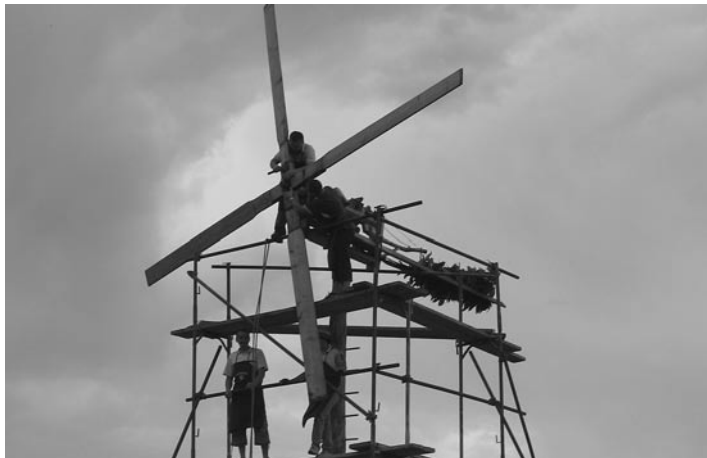
Postavitev klopotca na Grajenščaku

V poznem poletnem času v naših vinogradih že veselo pojejo klopotci, ki jih vinogradniki postavijo v vinograde, da bi preganjali morebitne nepridiprave. Klopotci napovedujejo letino, ki se je veseli vsak gospodar. Izdelani so tako, da jih poganja že najmanjši veter. Glede na velikost so razdeljeni v štiri razrede in vsi klopotci, veliki več kot 1 meter, so velikani, najmanjšim pa pravimo spominek. Njihova velikost je do 15 centimetrov.