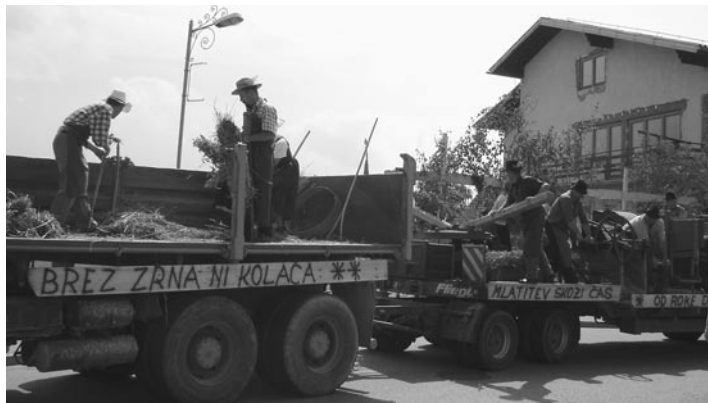
Občinski svetniki so menili: »Brez zrna ni kolača« in »od roke do stroja je pot razvoja«

polju s starim orodjem, skupina vaščanov iz Zg. Velovleka se je s konji odpeljala v Terme Urban, vaščani Jiršovcev so prikazali delo v vinogradu in pobiranje sliv ter izdelovanje sodov, skupina iz Ločkega Vrha je delala »tuklo«, skupina iz Desencev je prikazala »klopfanje sončnic«, skupina iz Vintarovcev pa trebljenje buč, vaščani Svetincev so izdelovali eko kurjavo – drva, članice društva kmetov so se predstavile z zimskimi kmečkimi opravili, skupina iz Janežovskega Vrha je izdelovala metle, v Placarju pa