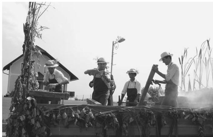
Izdelovalci sodov iz Jiršovcev