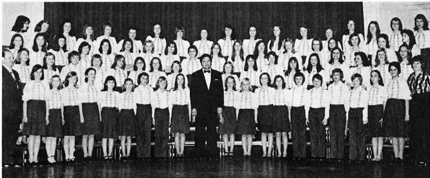
Mladinski zbor iz Maribora, ki bo ta petek 28. oktobra ob 20.30 nastopil v okviru letošnje abonmajske koncertne sezone v goriškem Avditoriju v ulici Roma