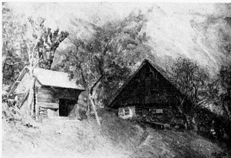
Rojstna hiša in čebelnjak Antona Janše