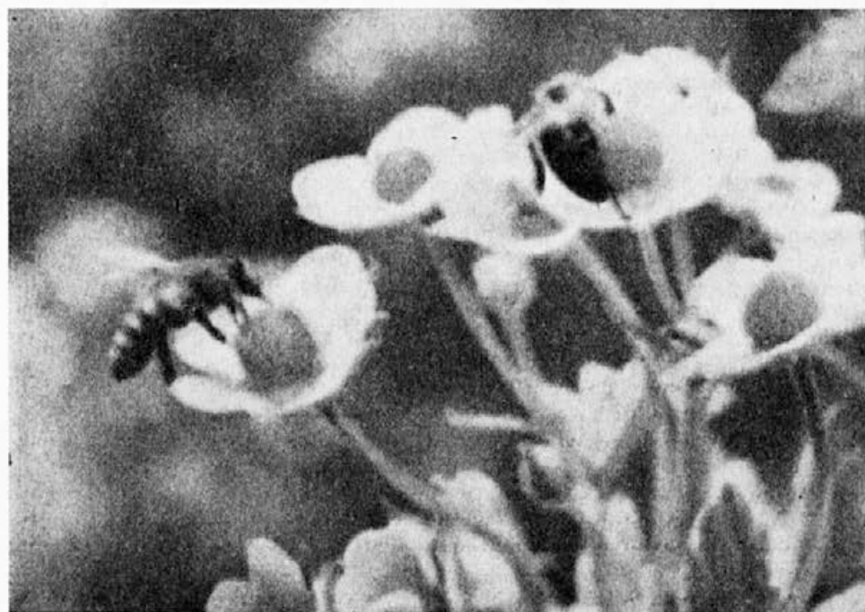
Čebele na zgodnjem spomladanskem cvetju

Gostije z mrtvicami so trajale do konca oktobra. Z nastopom hladnejših dni so ježki izginili, verjetno pod čebelnjak, kjer bodo prezimili. Privoščim jim sladko zimsko spanje. Izkazali so se za koristne, saj so okolico čebelnjaka temeljito očistili mrtvic, ki bi sicer razpadale in okuževale tla.