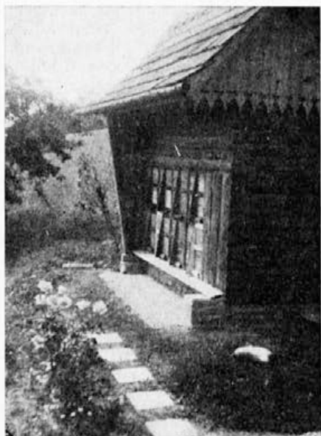
Čebelnjak mladega čebelarja

Precej letnikov naše revije sem prebral, pa nikjer nisem zasledil članka, ki bi pisal o ureditvi okolja čebelje družine, pa naj bo to panj, čebelnjak ali skladovnica panjev.