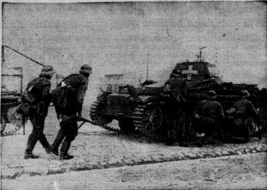
Nemška pehota je izvršila napad na Varšavo pod zaščito svojih tankov