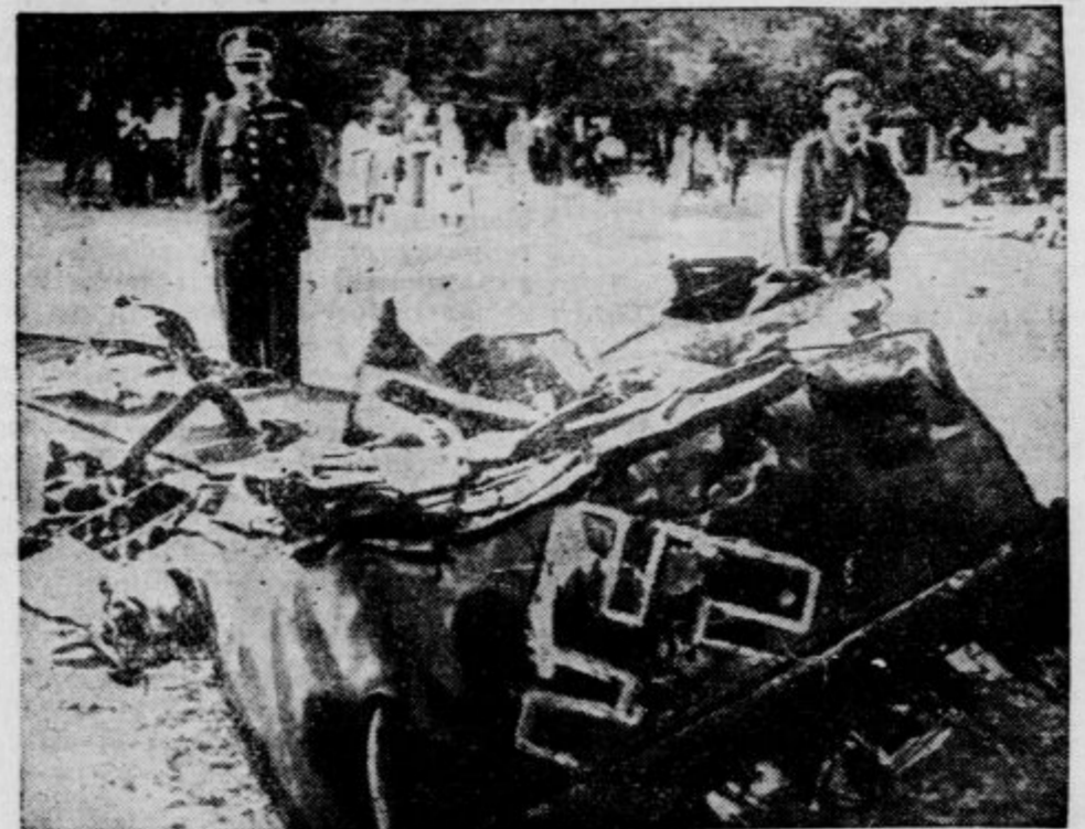
Vojaški aeroplan, ki se je zrušil sredi ulice v Varšavi