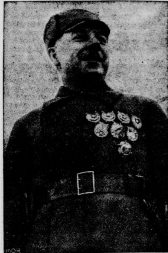
vrhovni poveljnik ruske vojske, ki je v noči od sobote na nedeljo prestopila poljsko mejo