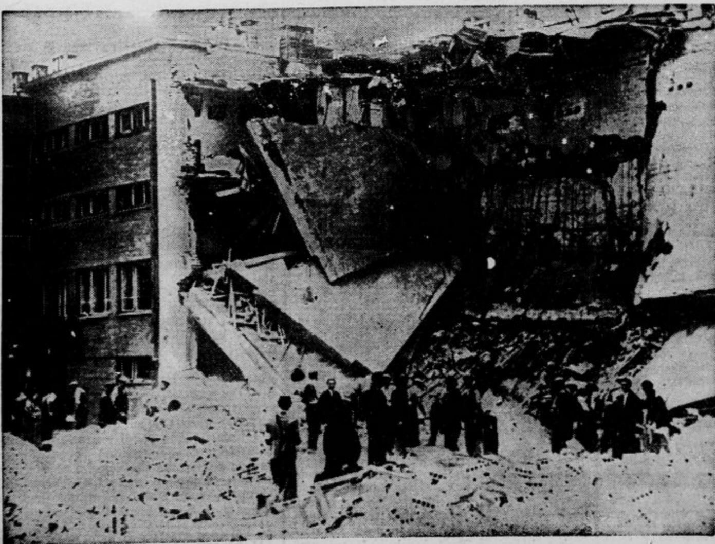
V predmestju Varšave je bomba z nemškega aeroplana porušila hišo