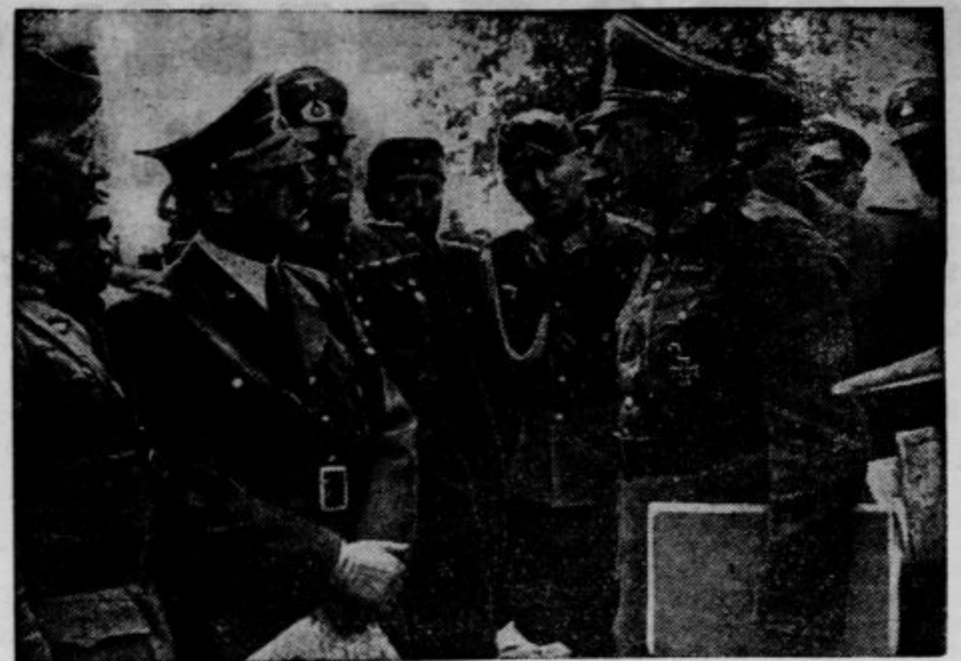
Državni kancelar Hitler se posvetuje s svojimi generali na poljskem bojišču