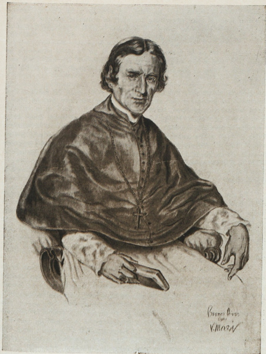
IRENEJ FRIDERIK BARAGA