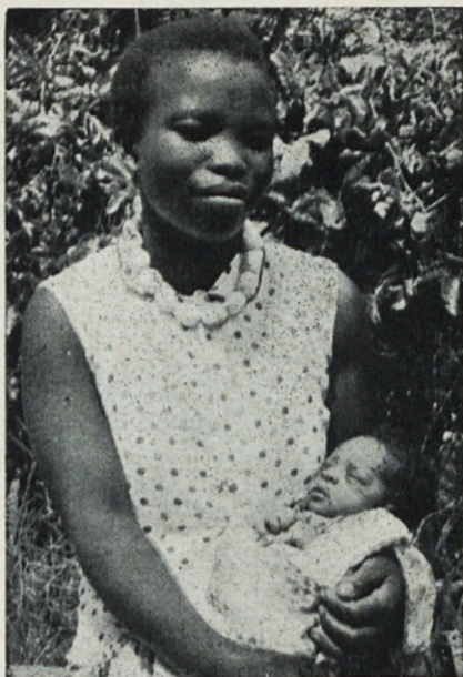
Zamorska mamica z novorojenčkom