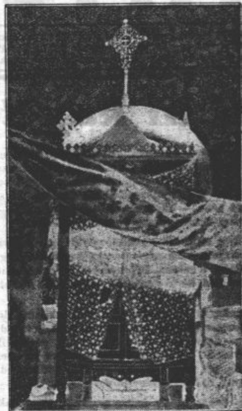
V abesinskem svetem mestu Aksumu so imeli shranjeno v posebnem svetišču skrinjo zaveze, katero so še o pravem času, preden so Italijani zasedli mesto, odpeljali v Addis-Abebo. Ta skrinja zaveze, katero kaže slika, je najsvetejši simbol abesinske koptske cerkve

V Abesiniji pa duhovniki po vseh cerkvah goreče pridigujejo proti Italijanom in povdarjajo, da so Abesinci samo zato lahko ohranili svojo vero, ker so ohranili svojo neodvisnost. Ljudstvo seveda z velikim navdušenjem sledi svojim duhovnikom i