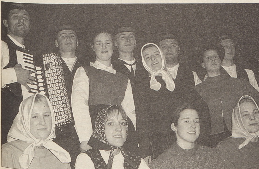
Mladi Globašani v oblačilih, kot so jih nosili njihovi predniki. Globaško ojset bodo uprizorili štirikrat.