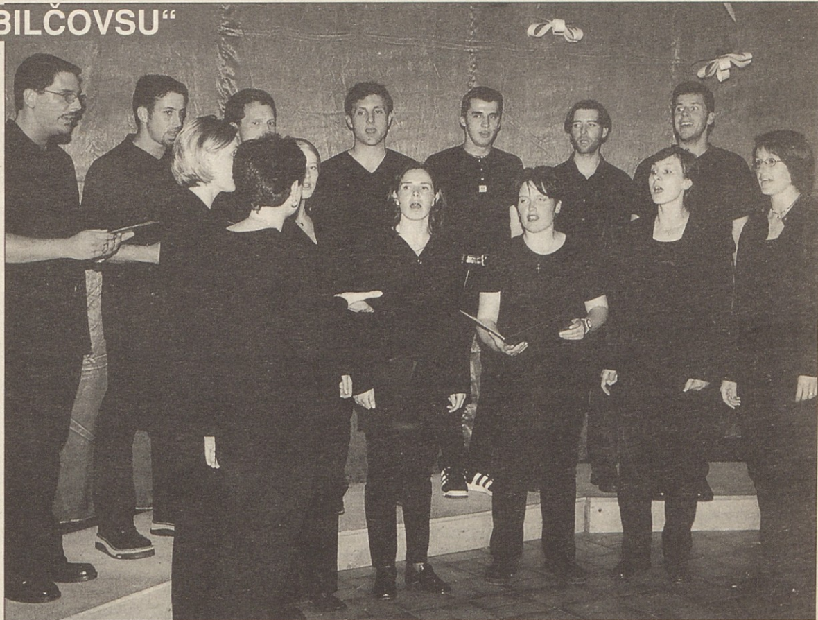
Vokalna skupina „Akzent“ iz Ledinc je preteklo nedeljo navdušila v Bilčovsu.