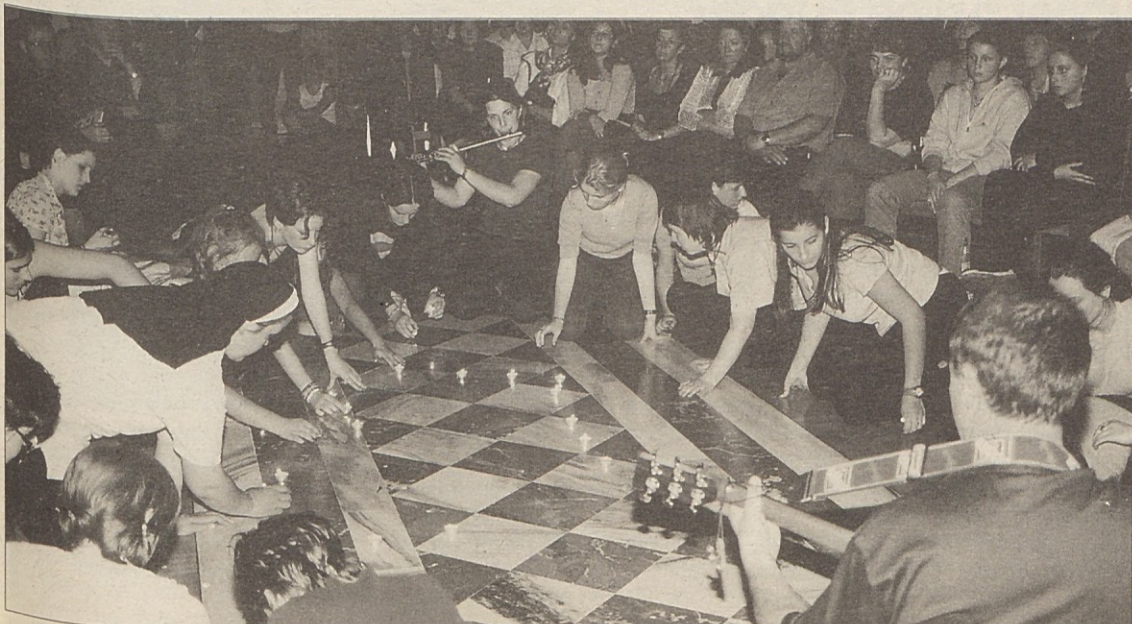
Letošnja zaključna prireditev šole v Šentpetru je bila izredno bogata in raznolika.