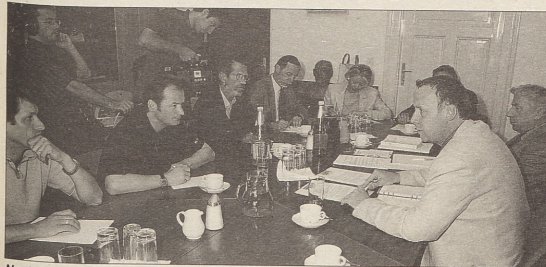
Novinarska konferenca NSKS. Apovnik (prvi z desne): „Če bosta dva učitelja enakovredna, se sprašujem, kdo bo v odločilnem trenutku imel zadnjo besedo? To je lahko samo ravnatelj. Toliko bolj je zato razumljiva zahteva po dvojezičnih ravnateljih. Drugače bomo imeli kaos.“