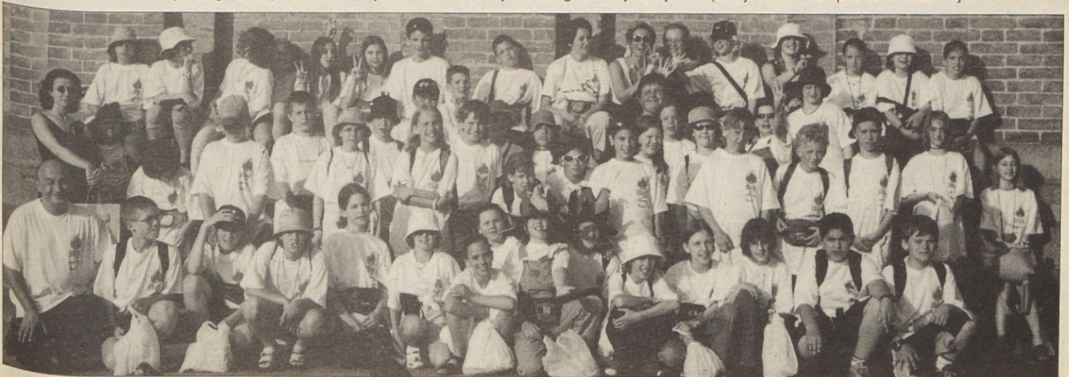
Gimnazijci Slovenske gimnazije so se v Italiji igranje učili italijanščine. Skupinska slika ob koncu seveda ni smela manjkati.

Program je obsegal tudi izlete: sprehod po Lignanu, večerja v pizzeriji, popoldan v Benetkah, ki je bil posebno doživetje.