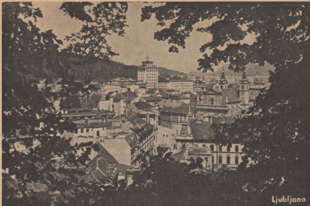
LJUBLJANA — PRESTOLNICA SLOVENIJE

Naše narodno kulturno delo bo bolj uspešno, če bomo v medsebojnih stikih s Slovenci, ki živijo drugod. Tako se bomo pri delu spodbujali in si svetovali. To medsebojno delo bo olajšano in pospešeno s poveza-