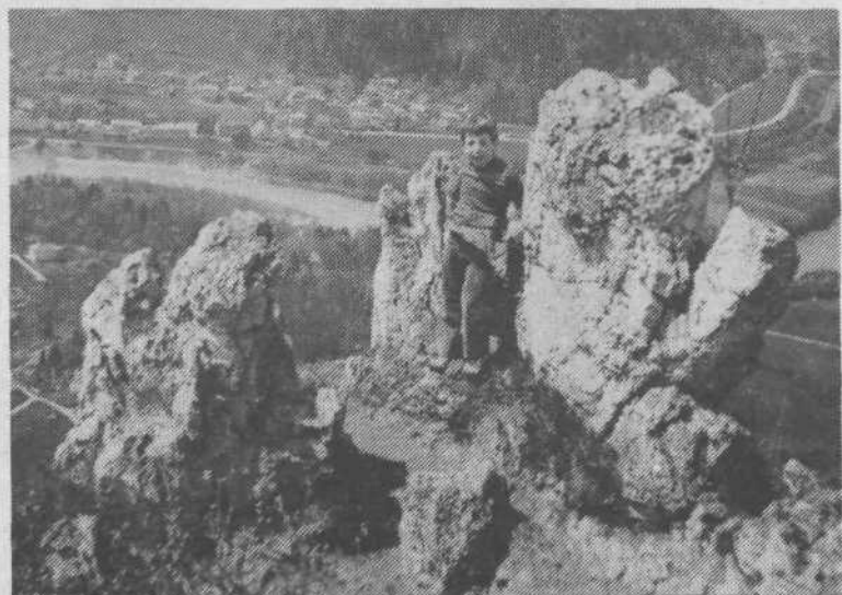
Prava spominska fotografija kot z visokih gora. Pa je le narejena sredi Grmade.