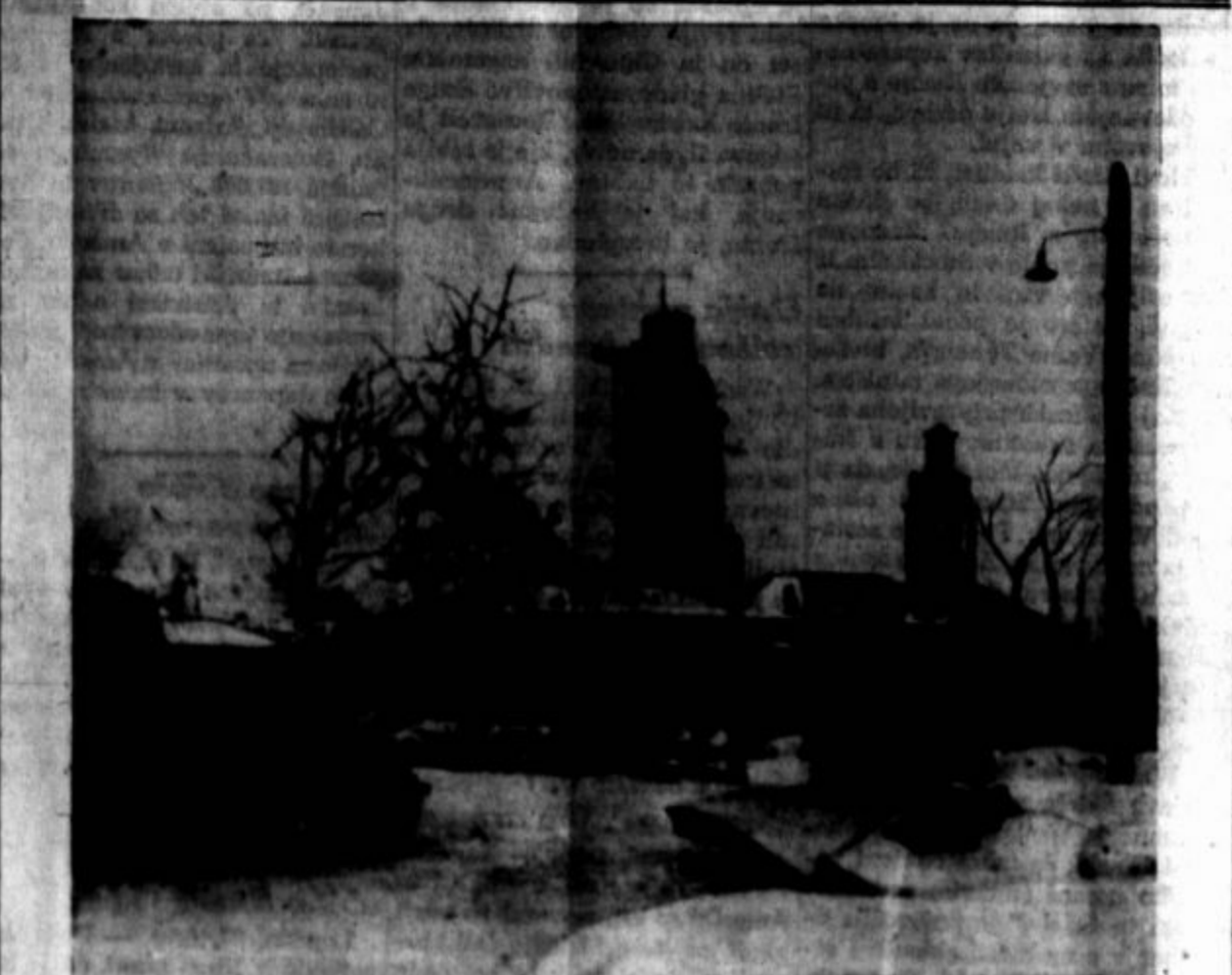
Ruski oklopni avtomobili v Schlussselburgu, trdnjanskem mestu, ki so ga Rusi zasedli po zlomu nemškega obloganja Leningrada.

SLOVENSKA NARODNA PODPORNJA JEDNOTA Izdaja svoje publikacije in posebno list Prosveta za korist, ter potrebno agitacijo svojih društev in članstva in za propagando svojih idej. Nikakor pa ne za propagando drugih političnih organizacij. Vsaka organizacija ima običajno svoje glasilo. Torej agitatorični dopisi in naznanila drugih političnih organizacij in njih društev ne smejo pošiljati listu Prosveta.