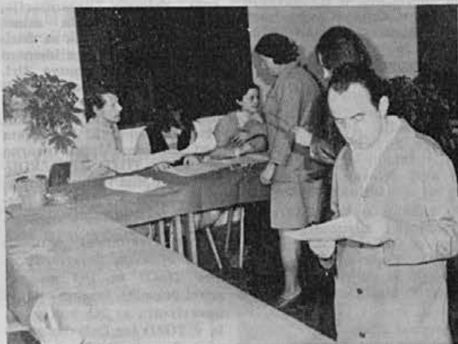
Na volišču delovne skupnosti skupnih služb