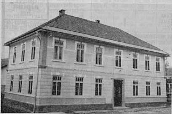
Člani gasilskega društva Dobračeva skrbijo tudi za vzdrževanje nepremičnin. V letu 1972 so na gasilskem domu obnovili streho, lani pa fasado

V letu 1973 je bil tudi sestanek s članicami in dogovorjeno je bilo, da se nekatere, ki niso več pripravljene sodelovati, prepíše v podporne. Glede na precejšnjo obremenjenost žensk je bilo tudi predvideno, da bi bila najprimernejša oblika delovanja predavanja iz preventive, ki bi jih organizirali v zimskem času. Sklenjeno je bilo tudi, da se nabavi nekaj uniform za članice.