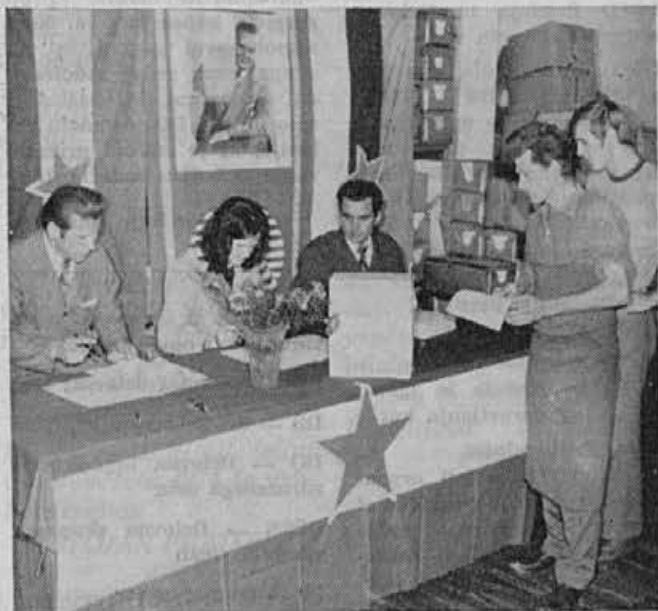
Ta posnetek je iz volišča za obrat podplatne izdelave in pomožne obrate