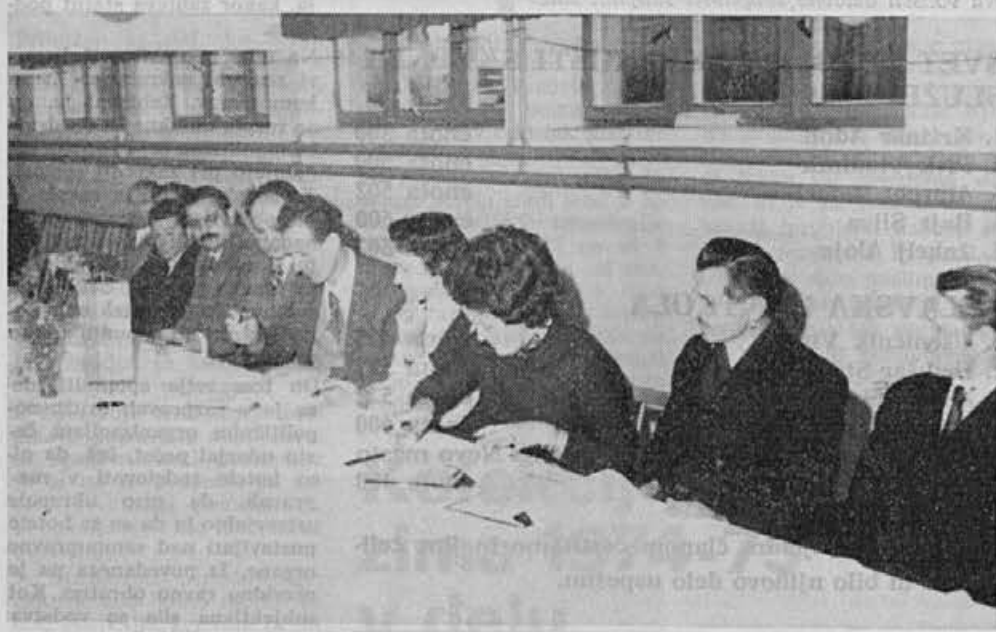
Svečani podpis samoupravnega sporazuma

pravo sliko bodočega samoupravnega družbenega življenja. Usmerili smo prizadevanje vseh članov našega združenega dela v skupen cilj s posebnim poudarkom na bolj temeljite in razčiščene odnose pri delu in življenju. V času priprav smo poskušali oblikovati bodočo samoupravno obliko in vodila pa nas je ista misel: da pravilno in do-