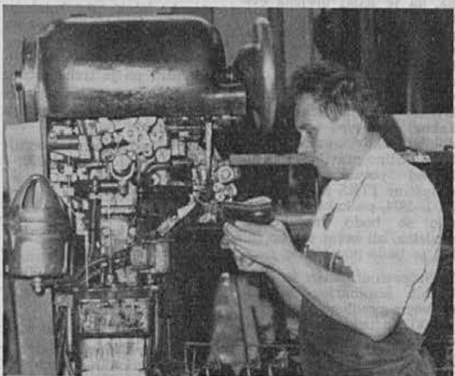
Pravilen prijem čevlja je eden glavnih faktorjev za varno delo na mnogih strojih v montažnem oddelku