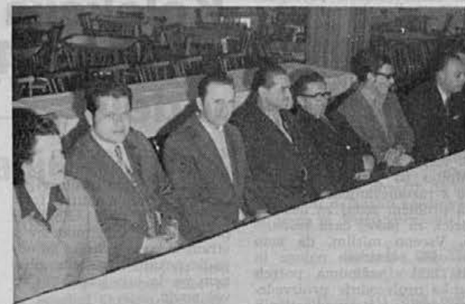
Svečanemu podpisu samoupravnega sporazuma so prisostvovali tudi predstavniki družbeno-političnih organizacij v podjetju in kraju

Delavska sveta sta bila sklicana na pobudo družbeno-političnih organizacij Alpine. Obravnavan razpis, ki je bil objavljen v Delu in prigovori na vsebino razpisa za delovno mesto direktorja delovne organizacije in vodjo TOZD Proizvodnje.