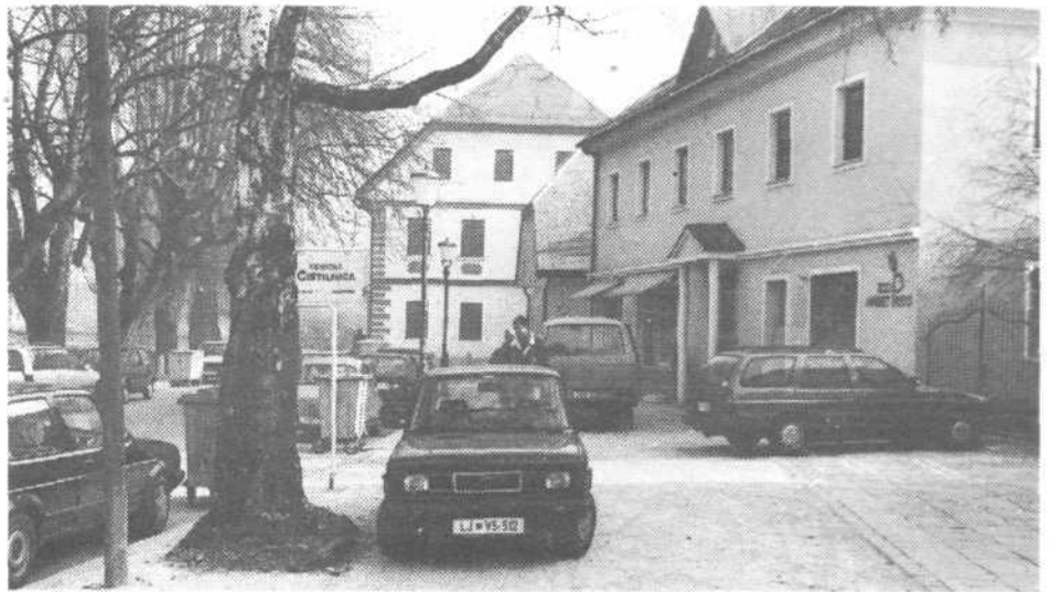
Nasilnost pločevine je žal prisotna tudi tu

vi 15 je trgovina Papirus, v še neprenovljenem delu pa bo drogerija, v Eiprovi 11 lastnik obljublja klasično slovensko gostilno z govejo juho in praženim krompirjem opoldne. Eiprova 9 in 13 še nista prenovljeni. Zanju je program obstajal, vendar ... Eiprova 19 ali nekdanja Dolenčeva kasarna, v kateri je trgovina Anika, Trnovski zvon in fotograf Keše, pa je v tem trenutku pretežak zalogaj.