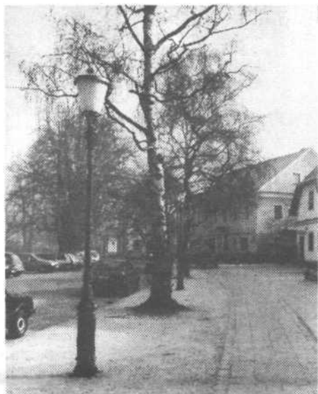
Ob brezovem drevoredu je lepa sprehajalna pot

Edinstven obvodni ambient, značilna usločena gradbena linija ulice, način parcelacije z ozkimi, vodoravnimi progami, postavljenimi pravokotno na ulico, so narokovali zaščito tega predela. Najprej seveda na papirju s sprejetjem načelnih prostorskih dokumentov in z razglasitvijo Trnovskega in Krakova za kulturni spomenik.