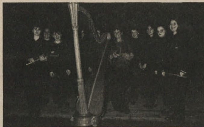
Slovenska umetnica-harfistka Pavla Uršič-Kunej in učenke SŠTUD Kočevje ob skupnem nastopu v Šeškovem domu

nosti, priznana slovenska umetnica Pavla Uršič-Kunej pa je na harfi izvajala recital na temo ŽENA. Svojo igro na harfi je dopolnila z ustno razlago o harfi, o njenem razvoju, kompozicijah in kompozitorjih za harfo. Tako je lepo izveden recital poezije dopolnil recital harfe, ki ga je Uršičeva izvajala impresionistično barvito.