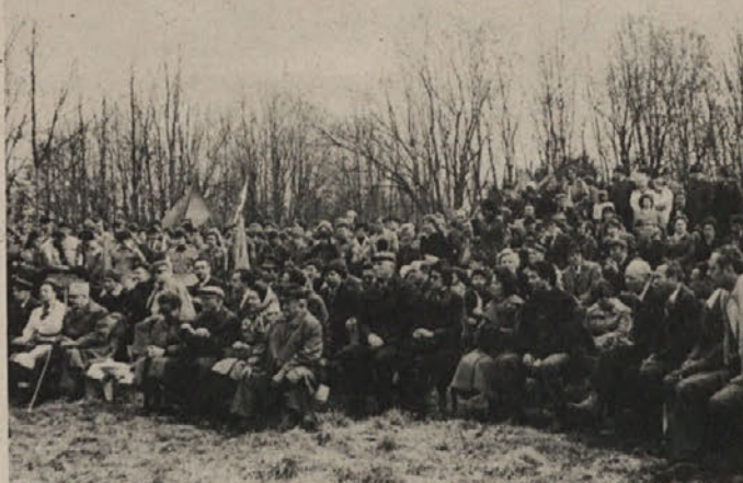
Udeleženci proslave na Pugledu, aprila 1978

Izvedla je prve svobodne volitve svojih predstavnikov za Zbor odposlancev slovenskega naroda v Kočevju, od koder je odpotovala slovenska delegacija na zasedanje AVNOJ v