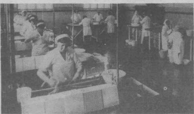
Odlična kvaliteta naravnih črev je odvisna od marljivih ženskih rok