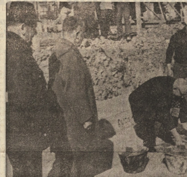
Bivši predsednik društva upokoencev Simonij postavlja temeljno opeko Doma upokoencev v Novi Gorici

Dom bo zgrajen po najsodobnejših zahtevah