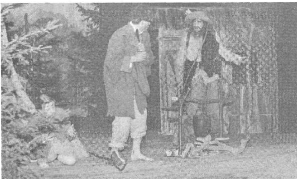
Prizor iz Kekca