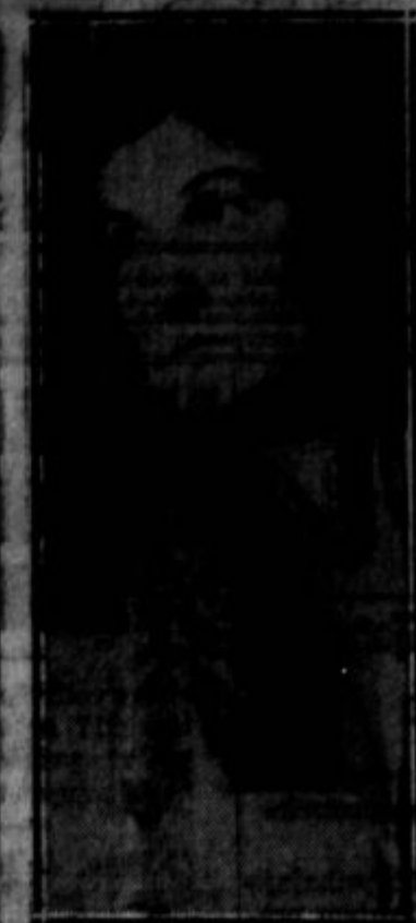
Mrs. Winnie Ruth Judd, Phoenix, Ariz., obtožena umora svojih moža.

Pri tem delovanju pa so izvršili tudi Slovenci svojo dolžnost, ker peti ward je tvoril eno izmed močnih socialističnih postojank. Seveda, takrat še ni bilo prepovedano, "vmešavati politiko v podpirne organizacije", ker takrat še nismo bili ta-