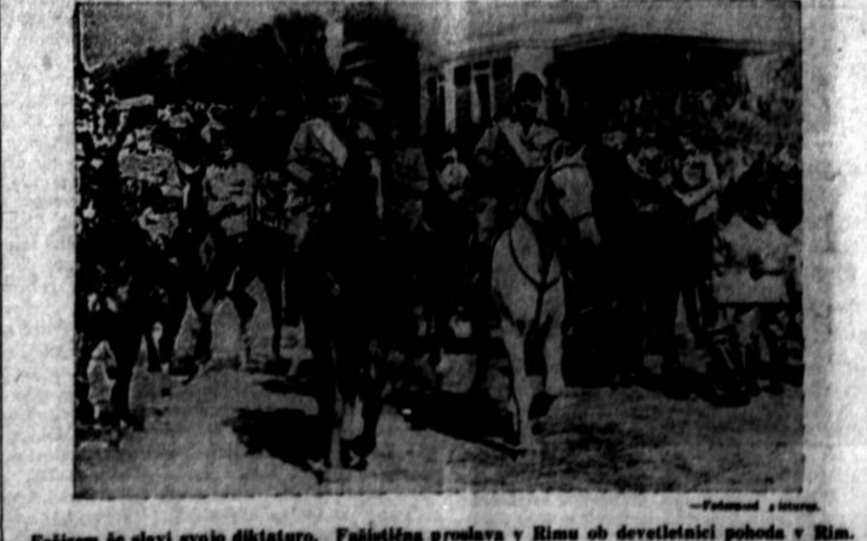
Fašizem se slavi svojo diktaturo. Fašistična proslava v Rimu ob devetletnici pohoda v Rim.

Houston, Tex. — Petnajst organizatorjev in članov koncila za brezposelne je bilo aretiranih, ko je policija navallila na shod, ki ga je sklicala ta organizacija in katerega se je udeležilo krog dva tisoč oseb. Aretirani delavci so bili obtoženi potepuštvu in pridržani v zaporu.