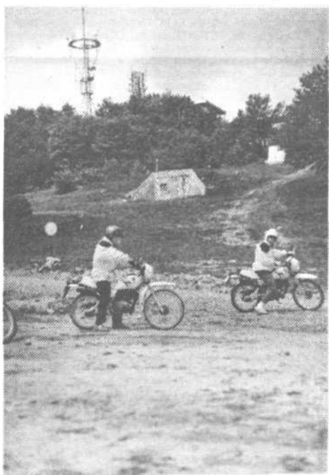
Z motorji z Barja na Krim