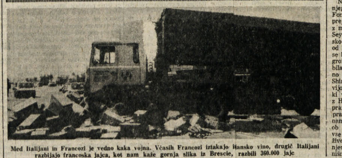
Med Italijani in Francozi je vedno kakva vojna. Včasih Francozi iztakajo hansko vino, drugič Italijani razbijajo francoska jajca...