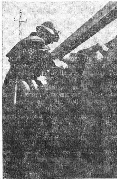
Postavljajo k težkim baterijam granate za nove boje...

Dovoljenje za prehod skozi Finsko je dobila sovjetska vlada za svoje čete, ki potujejo v sovjetsko oporišče Hanko.