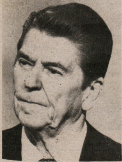
Reaganov predlog je šel po vodi

Z italijanske strani, je še dejal Craxi si bomo prizadevali, da bi med Vzhodom in Zahodom prišlo do pravičnih in konstruktivnih odnosov, ki bi utegnili prispevati k obnovitvi procesa popuščanja napetosti. Zato gledamo z zaupanjem, je še dejal, na obnovo pogajanj o nadzoru in skrčenju oborožitve.