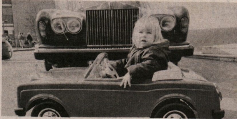
Zaenkrat se mali Anglež vozi v malem Rolls Roycu. Ko bo zrastel, si bo privoščil velikega, če bo sreča... (Telefoto AP)