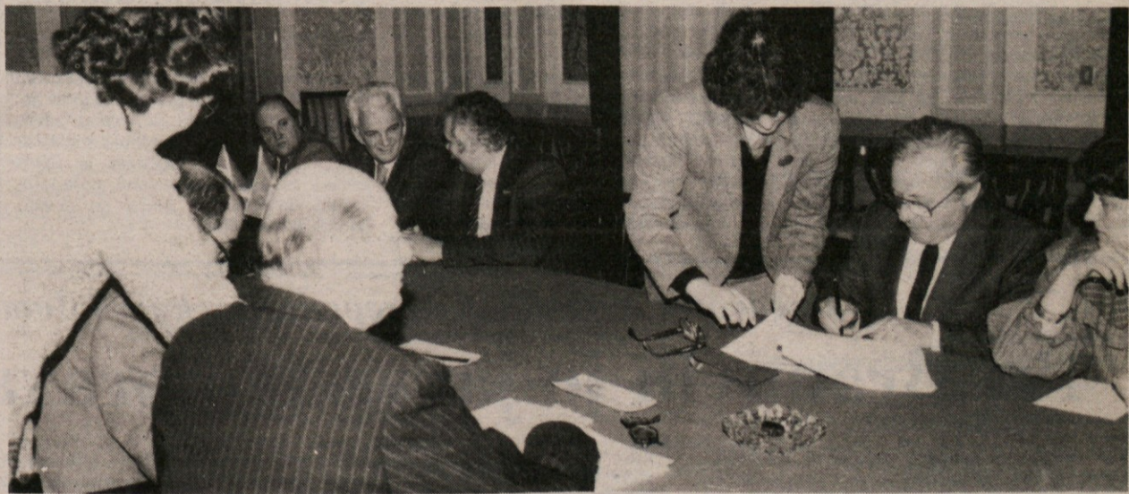
Podpisovanje zapisnika na goriški prefekturi

Tako se je zgodilo, da je skupna nesreča obeh Goric med lanskimi poplavami iz čisto praktičnih in življenjskih potreb privedla do tesnega sodelovanja ustreznih služb in njihovih strokovnjakov. Vsako zlo je za nekaj dobro. (gv)