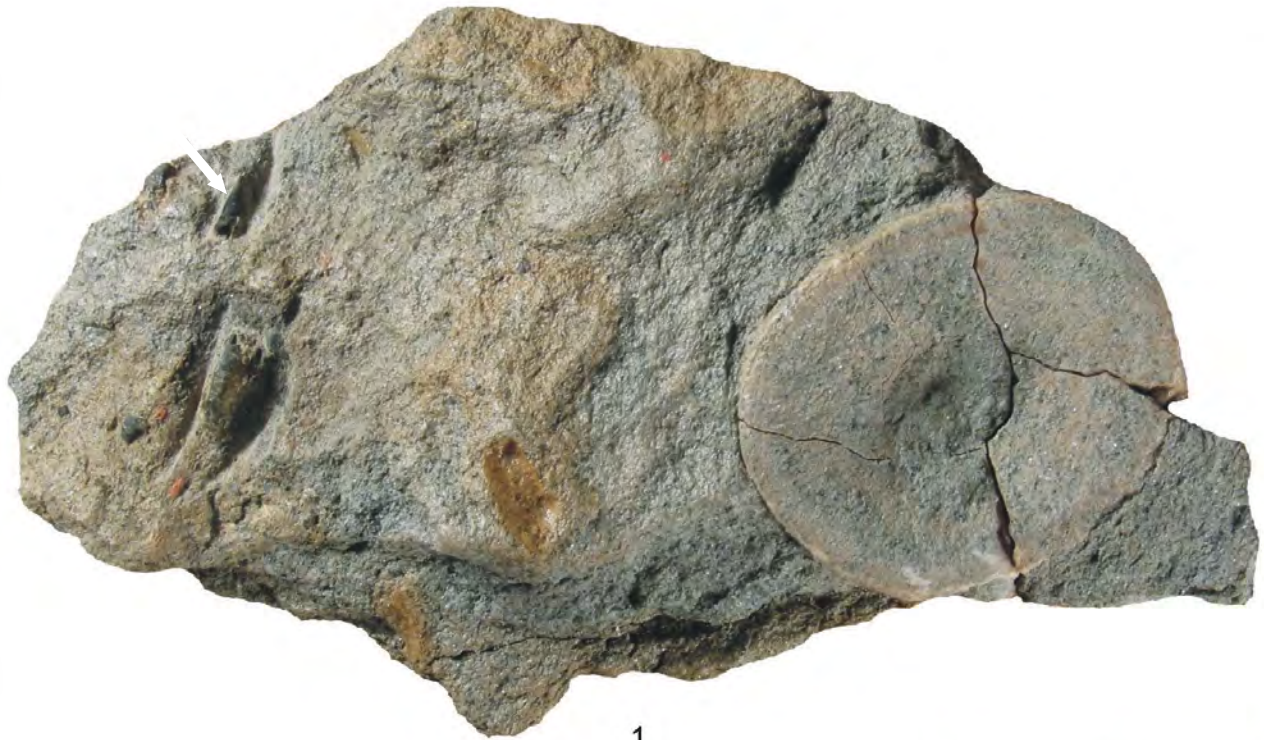
TABLA 1 – PLATE 1