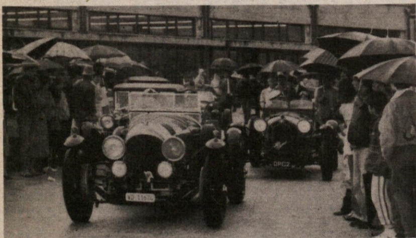
Znamenite avtomobilske dirke »Tisoč milj« po Italiji so ukinili leta 1957. Vendar so ostale v tako živem spominu, da so jih letos priredili v stari obliki — da bi spomin ne umrl