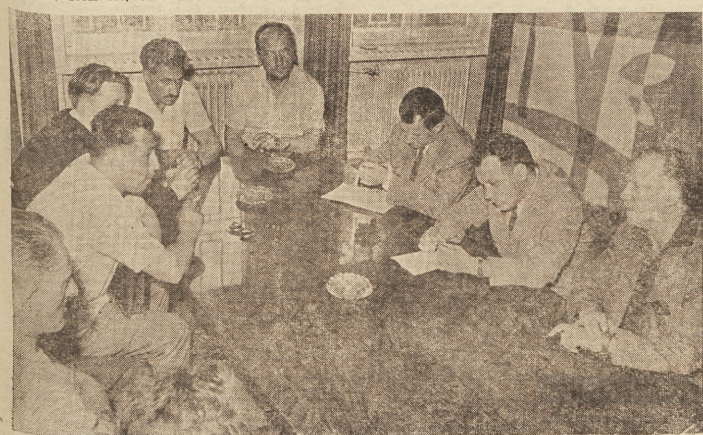
Mariborski telesnokulturni delavci, zbrani na sestanku z novinarji »Početa«. Več o tem sestanku berite na 3. strani

LOKOSTRELSTVO — Pariz: evropsko prvenstvo (do 8. VII.).