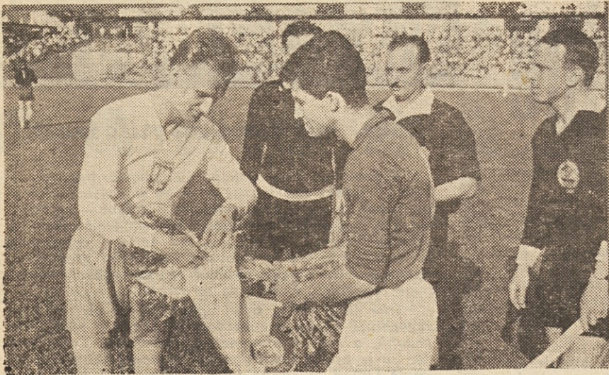
Kapetana mladih reprezentanc Poljske in Jugoslavije sta izmenjala spominska darila

Sonce in zrak — za oba, ki ju vidimo na sliki, Zirovnik se v vročem gorenskem soncu trudi nabrati čimveč moči za nastop na amaterskem Tour de France-u, prikupna kopalka pa se je odločila za prijetnejšo varianto, za vožajo s čolnom po morju in za podvodni lov