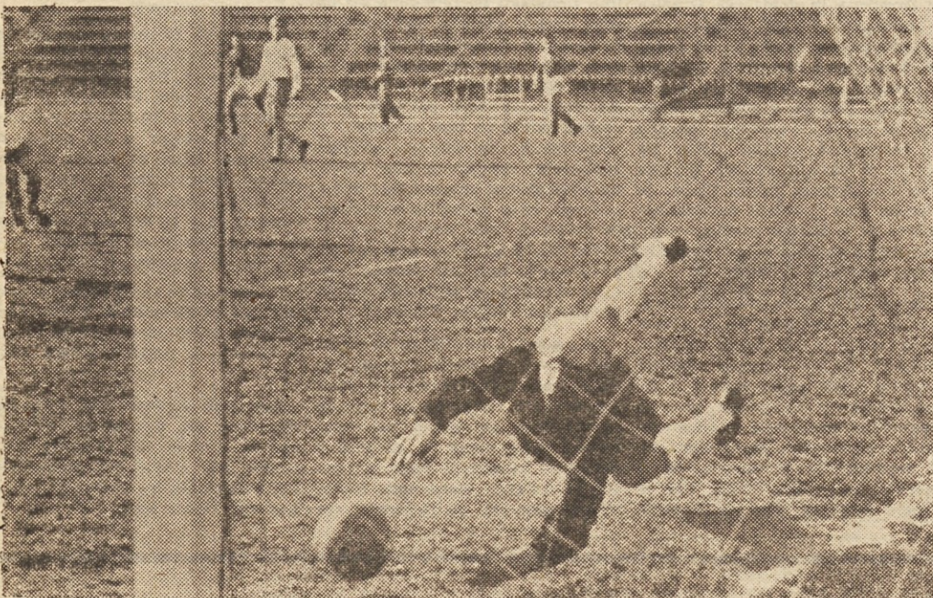
Poljski vratar je imel kljub dokaj medli igri naših nogometašev precej dela. To je bil oster strel Frančeškina, ki ga je vratar ujel z zadnjimi močmi