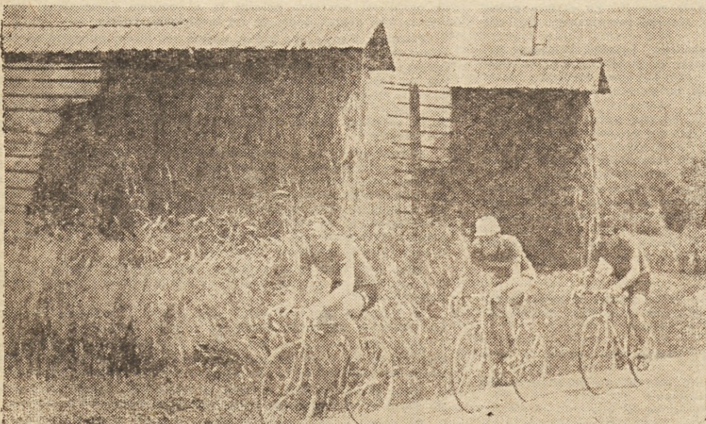
Sebenik, Zirovnik in Petrovič so dan za dnem takole vozili po dolgem in počez po Gorenski, da bi se čim bolj pripravili za amaterski Tour de France.