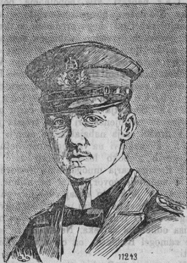
11243 Kommandant Steinbrück.

Prinašamo sliko nemškega pomorskega ober-lajtnanta Otto Steinbrück, ki se je kot