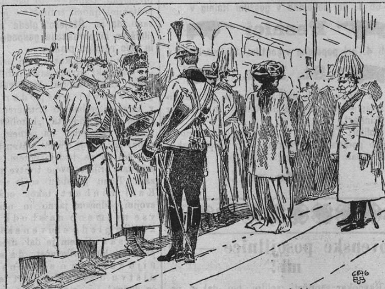
Ankunft des deutschen Kronprinzenpaares in Wien.

Nemški prestolonaslednik in njegova žena sta bila več mesecev na potovanju. Zdaj sta prišla zopet nazaj. Pri temu sta se pa pripeljala tudi čez Dunaj, kjer sta našega cesarja obiskala. Naša slika kaže sprejem prestolonaslednika in soprage na južnem kolodvoru na Dunaju. V ozadju vidimo bodočo nemško cesarico poleg našega cesarja. Spredaj pa stojijo avstrijski nadvojvode v pogovoru z nemškim prestolonaslednikom, kareri je v huzarski uniformi.