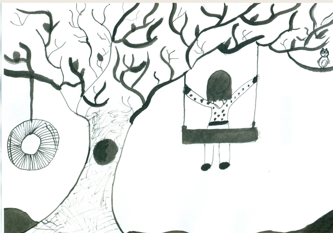
Anja Gjerek, 7. b

Vzgojni načrt sprejme Svet zavoda na predlog ravnateljice.