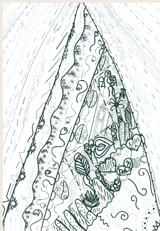
Nika Šalamon, 7. a