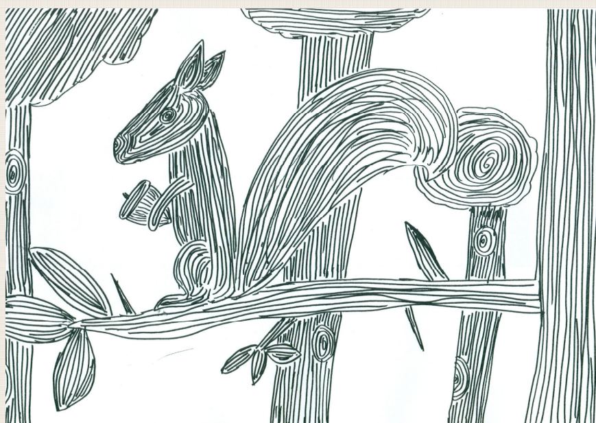
Sven Rojten, 5. a

Pravila OŠ Polzela o prilagajanju šolskih obveznosti začnejo veljati 1. 9. 2008 z dopolnitvami 2. 9. 2013.