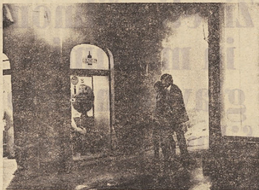
»Slučajno življenje« — režiser Ante Peterlić (Studio Zagreb)

pomočjo snemalca, montažerja ali scenografa. Snemalna knjiga na profesionalen način pojasnjuje, kako se naj film snema. Vse, kar je v scenariju opisano literarno , se v snemalni knjigi »prevaja« v filmske slike , opisane z besedami.