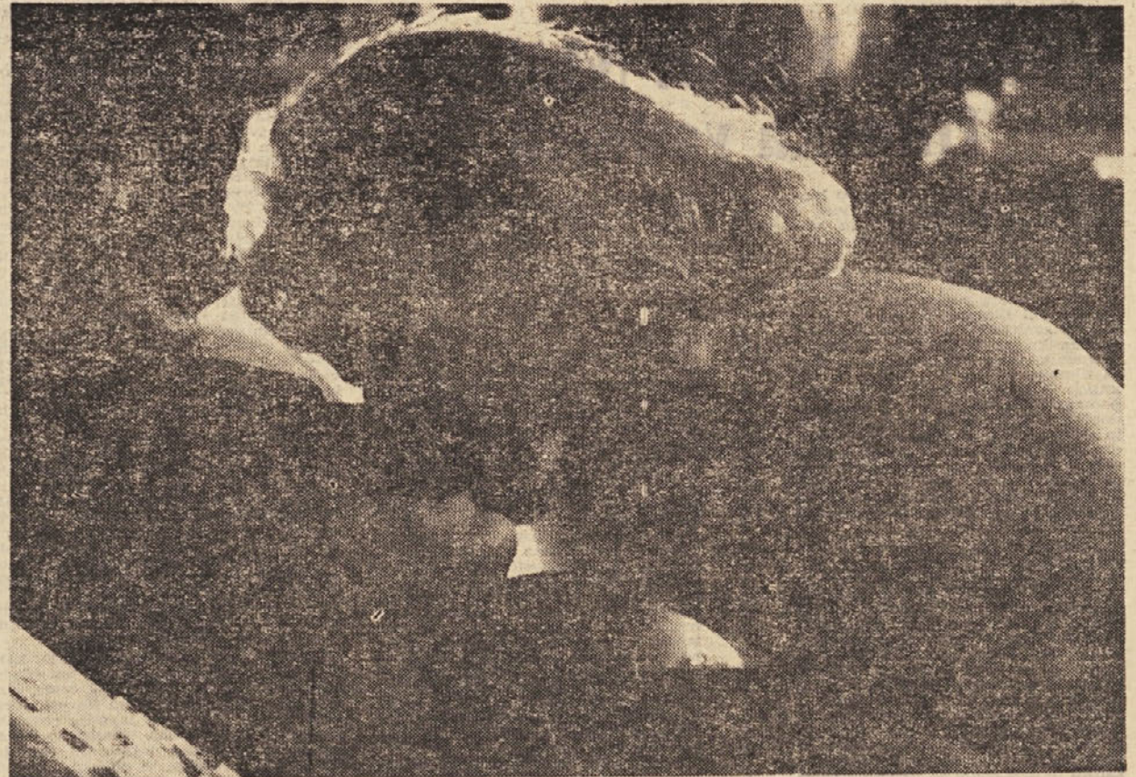
Iz filma »Uboj« — režiser Žika Mitrović (Beograd)